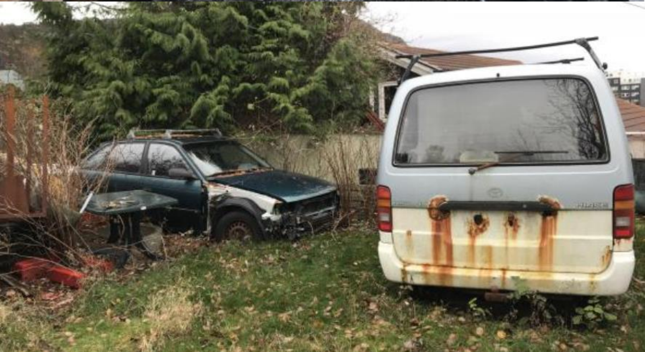
Foto: Dette er d me p  fors ppling. Her har privatpersonar i eit byggefelt lagra avfall som er skjemmande, fors plande og som kan f re til forureining p  eigedommen sin.