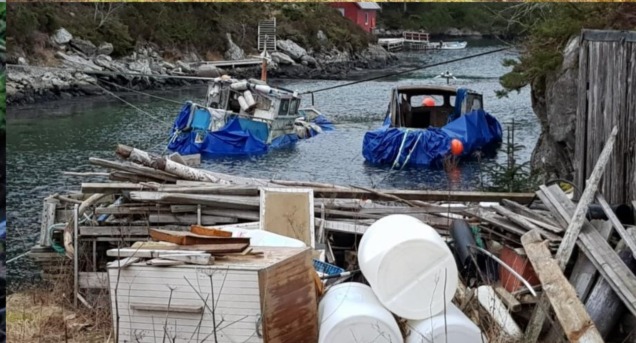
Foto: Kasserte køyretøy, ulovleg brenning av avfall, plastforsøpling i elv og båtvrak. Kommunen er miljømyndighet for forsøpling etter forureiningslova.