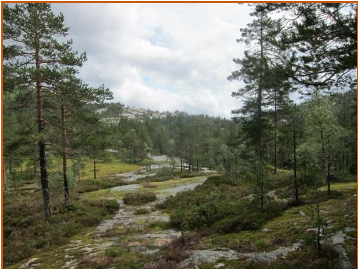
Fattig barskog i sein optimalfase pregar dalføret under Skulehomsfjellet.

I samsvar med mangelanalysen for skogvern (Framstad mfl. 2017) vil Skulehomfjellet i middels grad bidra til inndekning av manglar i skogvernet. Området dekker i fyrste rekke opp viktige manglar knytt til inndekning av viktige mangelnaturtyper, men også til en viss grad generelle manglar.