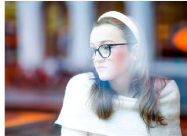
Det er nå i overkant av 60 FACT-team for voksne og rundt 20 FACT-ung-ivm. De gir oppvekst og integrert behandling til ungdom eller voksne med alvorlige psykiske helseutfordringer og store vansker på flere livsområder, skriver Kristin Traasa.