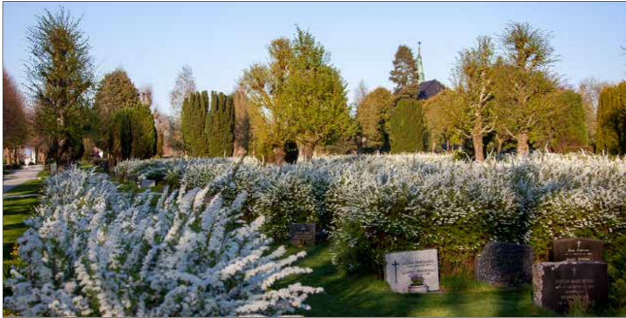
Blomstrende spireahekker rammer inn gravfeltene på Eiganes gravlund i Stavanger.