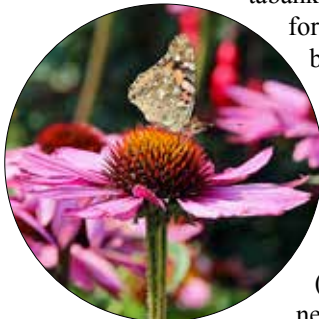
Sommerfugl, midt i matfatet.

Ved valg av planter er det viktig å sjekke www.artsdatabanken.no . Artsdatabanken er en kunnskapsbank for naturmangfoldet og har blant annet rødlista for naturtyper og arter og fremmedartlista.