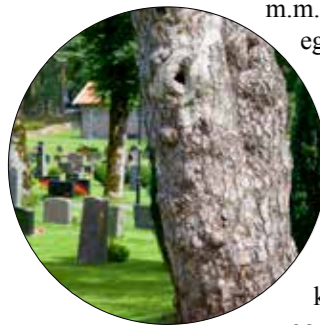
De dødes hage, et sted for ro og ettertanke.

Naturen er mer produktiv og robust når artsmangfoldet er intakt. I naturen er det et samspill mellom arter, hvor de fleste arter påvirker andre arter i ulike næringskjeder og komplekse kretsløp. Arter har ulike funksjoner, som å pollinere, fikserer nitrogen, spre frø, bryte ned organisk materiale, blande jorda, spise andre arter, produsere biomasse m.m. Hver og én spiller de sin egen rolle.