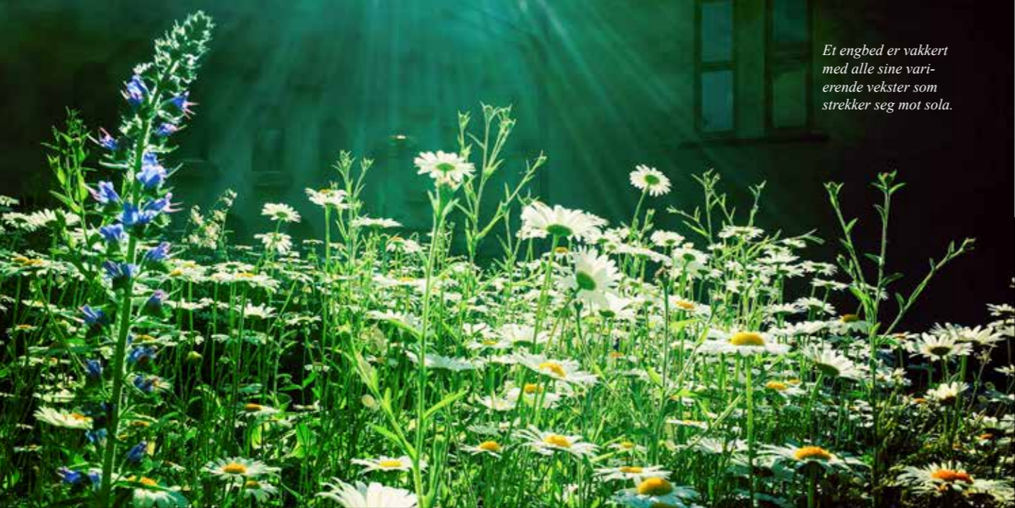
Et engbed er vakkert med alle sine varierende vekster som strekker seg mot sola.

«Både gamle og døde trær er viktige leveområder for insekter, sopper, lav og mose. Her finnes også hulrom som fuglene benytter som hekkeplass og skjulested».