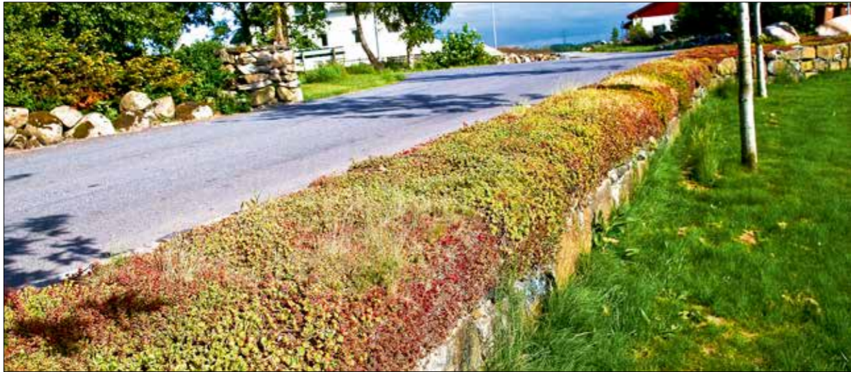
Bergknapp (sedum) er et eldorado for insekter.

Det vil gi viktige kvaliteter til anlegget. I tillegg er det økonomisk lønnsomt og ikke minst bærekraftig.