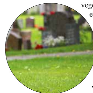
Trenger gressplenen en utfordrer?

Valg av areal for gravplasser og gravplassutvidelser er viktig for naturmangfoldet. Både i forhold til hva som er på stedet av terreng, jordsmonn og vegetasjon og hva området er egnet for når det gjelder endringer og innføring av nye arter. Lokalklima er også en viktig faktor for naturmangfoldet.