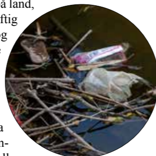
Plast på avveier truer livet i havet.

I 2015 vedtok FN 17 bærekraftsmål som skal fungere som et felles globalt veikart for nasjoner, næringsliv og sivilsamfunn. Det er særlig mål 14, Livet på havet, og mål 15, Livet på land, som omhandler bærekraftig bruk av økosystemer og som forsøker å stoppe det globale tap av artsmangfold.