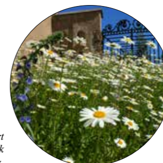
Engbed, etablert med norsk frøblanding.

Erfaringene så langt er positive reaksjoner fra de som besøker gravplassen.