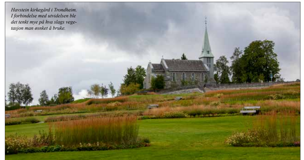
Havstein kirkegård i Trondheim. I forbindelse med utvidelsen ble det tenkt mye på hva slags vegetasjon man ønsket å bruke.