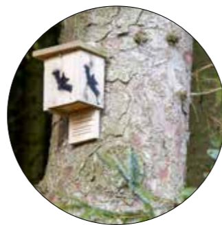
Flaggermuskasser: Viktige tiltak for truede arter.