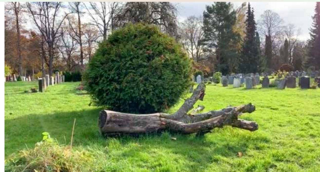
En morknende trestamme, rik på naturmangfold, er naturens egen skulptur.

«Både gamle og døde trær er viktige leveområder for insekter, sopper, lav og mose. Her finnes også hulrom som fuglene benytter som hekkeplass og skjulested».