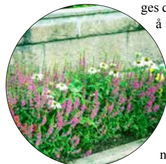
Pollenvennlige staudesorter avløser hverandres blomstring.

flerårig ugras er en forutsetning for å lykkes med stauder. Ved etablering legges det vekt på å plante tett for å få god dekning og mindre behov for lusing. De er kritiske ved innkjøp av planter. Sunne stauder i god vekst er et godt utgangspunkt.