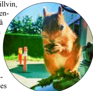
«Pablo» har blitt et fast element på Vestre gravlund i Oslo.

sektene, planter de gjerne blomstrende slyngplanter ved roten til stubben. Aktuelle arter kan være villvin, klematis og klatrehortensia. Det er også vanlig å legge igjen stammer fra gamle trær. I nedbrytingsfase har stokkene et yrende mikroliv, og fungerer også som leveområde for insekter. Trestokkene omtales gjerne som naturens egne skulpturer. I forbindelse med beskjæring av trærne lar de gjerne noe dødt materiale, tørre stubber med hulrom og lignende, stå igjen for å brukes som hus til ekorn, fugler og insekter.