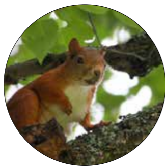
Enkle grep for tilrettelegging av et rikere dyreliv.