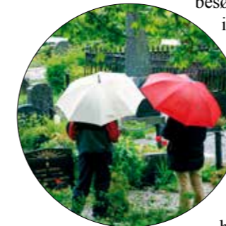
De dødes hage, et godt sted å være for de sorgende.

Gravplassen er de dødes hage og et møtested for de etterlatte og andre besøkende. En møter stedets identitet og de sterke tradisjonene knyttet til gravplassen med ydmykhet. Gravplassen rommer og ivaretar verdighet for de døde og omsorg for de levende. Den inkluderer, omfavner og trøster. Kan vakre gravplasser hjelpe oss i møte med døden?