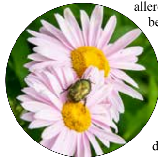
Besøk av en tege med sin karakteristiske trekant på ryggen.

Vegetasjonen på gravplassen vokser og endrer gravplassens uttrykk over tid. På et tidspunkt dør vegetasjonen og det må tas stilling til om den skal erstattes. Andre steder er vegetasjon allerede fjernet eller det er behov for å supplere eller endre beplantningen. Det vil være hensiktsmessig å ha en helhetlig plan som grunnlag for de konkrete tiltakene. En del gravplasser har en planteplan allerede, men det kan være behov for endringer i denne. Der det ikke foreligger en plan kan det være nødvendig å utarbeide en helt ny planteplan.