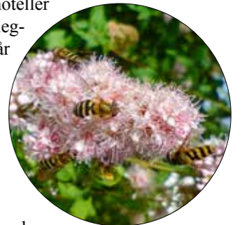
Blomsterfluene truer ingen.

Dette kan forhindre spredning av arter som kan skade norsk natur.