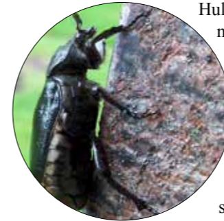
Vi må trygge leveområdene for truede arter: Her en eremittbille fra Tønsberg kirkegård.

God forvaltning og årlig tilsyn av gamle trær kan gi den nødvendige trygghet slik at de kan beholdes lengst mulig. Aktuelle tiltak kan være bardunering, oppstøtting og beskjæring. Det anbefales å ta kontakt med erfarne trepleiere for å få en vurdering av gamle trær og ikke minst gjennomføring av tiltak på gamle trær.