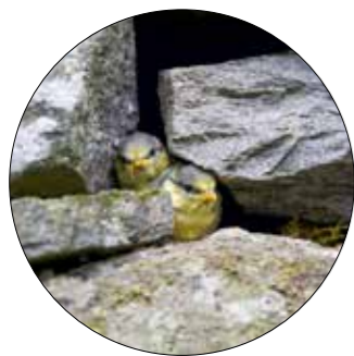
I et gammelt steingjerde på en gravplass titter disse to fram.

råder som kan ligge i fred over lang tid, også i byer og tettsteder. De har potensiale til å være et leveområde for mange ulike plante- og dyrearter. Landskapsøkologer og ulike miljøvernorganisasjoner peker på viktigheten av å bevare og tilrettelegge for dette naturmangfoldet.