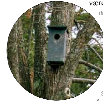
Fuglekasser er viktig hjelp for mange fuglearter, i denne har kaiene sitt oppholdssted.

«Bruk av løk og stauder/prydgress er et godt og miljøvennlig alternativ til sommerblomster. Det kan også være aktuelt i plantefelt foran gravminner».