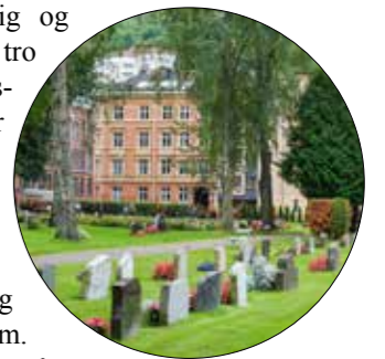
En grønn lunge midt i storbyen.

Gravplassen er offentlig og for alle, uavhengig av tro eller livssyn. Den er livssynsåpen og gir rom for at den enkelte bringer med seg sin tro eller sitt livssyn.