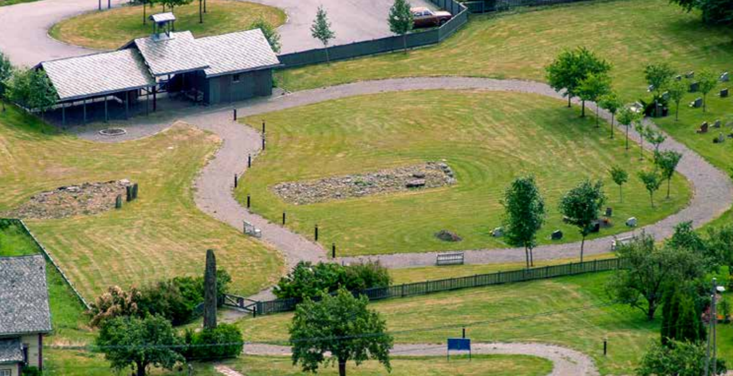
Husabø i Leikanger er en gravplass som representerer kontinuitet og tidsdybde.

Mange av våre gravplasser har vært i bruk over lang tid og preges derfor av endringer i kultur- og samfunnsutvikling. De er ofte rike på kulturminner. Gravplasser representerer kontinuitet og tidsdybde.