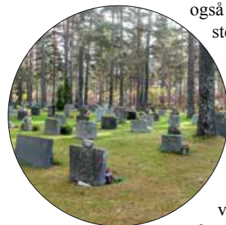
Eksisterende beplantning er av stor verdi og bør bevares så langt det er mulig.

Tiltak under neste kapittel, om endring og drift, er også relevant for planlegging av gravplasser.