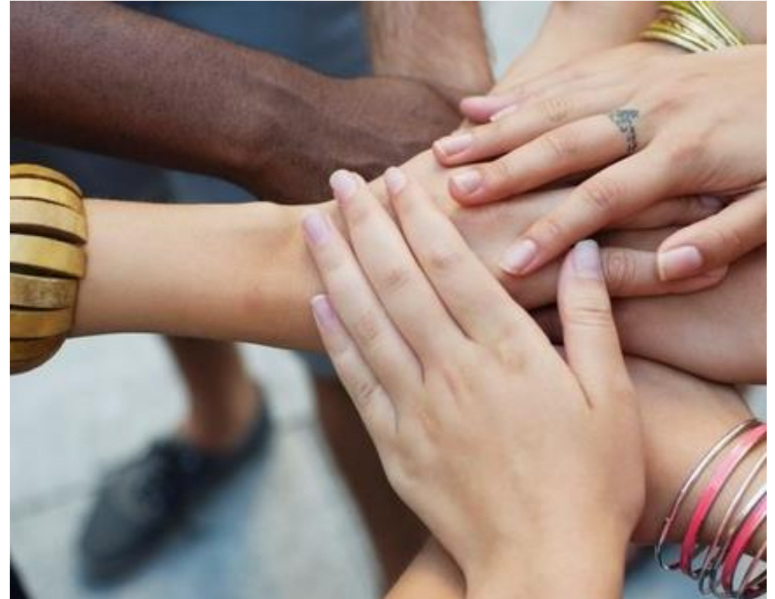
Solidarinnkreving - når flere er ansvarlig for samme krav - Statens innkrevingsentral (sismo.no)