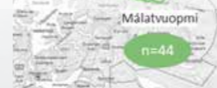
Kárta mii čájeha bohtosiid dálá PCR-iskosis mas leat iskan iešguđetge virusiid gávccii iešguđet jogain.

Dán prošeavttas leat mii iskan leago luondduloossaveajehiid Davvi-Norgga jogain njommon virus mii lea dábalaš biepmahagain. Iskkadeapmi čađahuvvui PCR-guorahallama vehkiin. Bohtosat duođastit ahte lea leat unnán virusnjoammumat luondduloosaide daid jogain gos mii leat iskan njoammuma. Bohtosat sáhttet geažuhit ahte njoammumat dán guovllu luondduloosa veajehiid jogain hui hárvé dáhpuhuvvá.