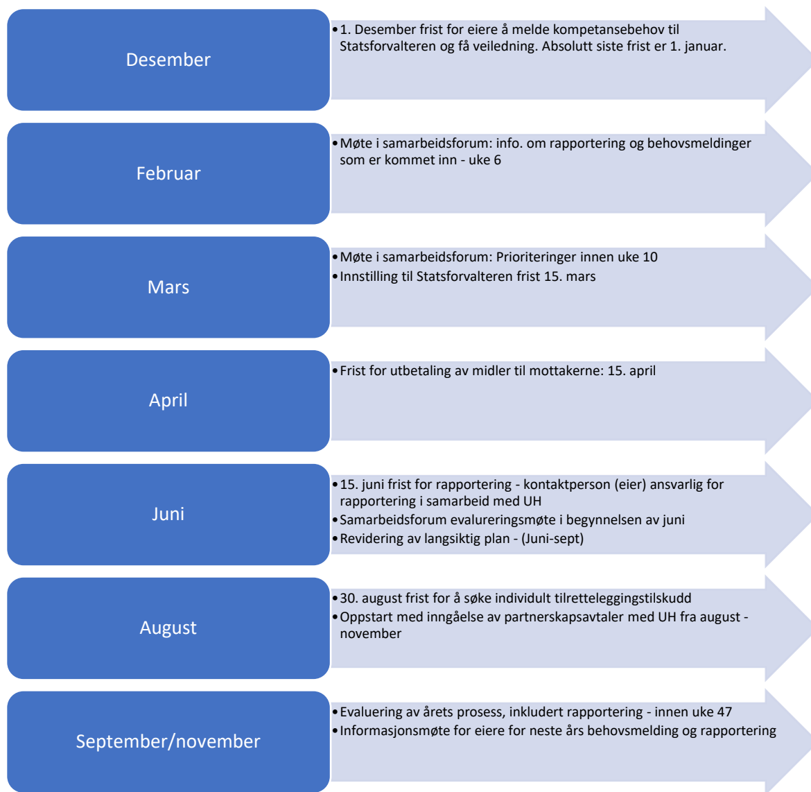
Figur: Årshjul – tidsplan for Rekomp i Troms og Finnmark

Hvem som er representanter i samarbeidsforum, finnes det en oversikt over på Statsforvalterens hjemmeside 22 .