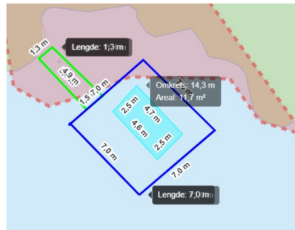
Figur 1 Situasjonskart

Stavanger kommune ved avdeling Park og natur har kommet med en uttalelse til saken 21.08.2024. De fraråder at det blir gitt tillatelse til etablering av badstue med omsøkt plassering.