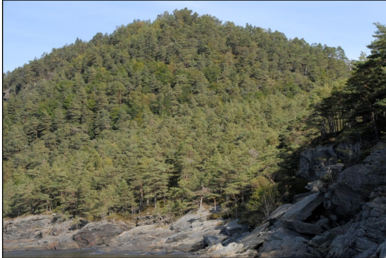
Foto: Raudkleivfjellet frå Ramsvik er sørvendt, med gamal furuskog og innslag av gamal eik og hassel.

Området som i dag er føreslege som innlemma i naturreservatet er brattare røsslyng-dominert furuskog. I den bratte lisida er det stadvis betre jordsmonn og eksposisjon med større innslag av eik, kristtorn, hassel, vivindel m.fl, nokre stader med storfrytle og fragment av lungeneversamfunn på eik.