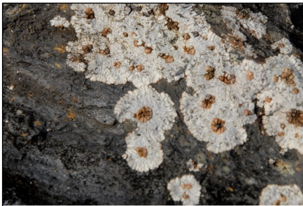
Foto: Knøllav veks på strandberga.

Overordna bevaringsmål vil vere å ivareta verneføremålet slik det er gjort framlegg om i verneforskrifta § 1. Etter slutført verneprosess vil forvaltningsstyresmakta peika ut meir detaljerte og prioriterte bevaringsmål, tilstandsindikatorar og overvakingismetodar.