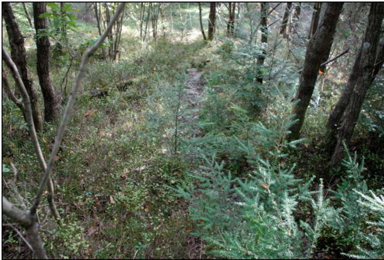
Foto: Oppslag av hemlokk i nytt føreslege verneområde. Må haldast nede for å ivareta verneverdiane.

Andre moglege framtidige trugslar vil kunne vere fysiske inngrep, hogst, og framande artar.