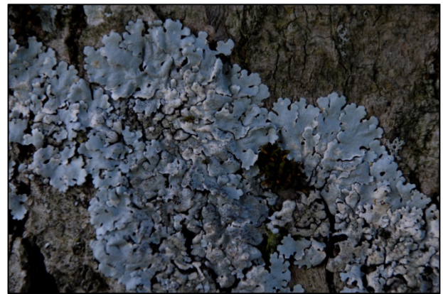
Foto: Liten lindelav er en kystlav som veks på strandberg og trær.