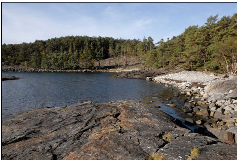
Foto: Kystlina langs Breivik. Midt i bilete ser ein hogstfeltet frå hogsten av plantegrøn i 2011.

Naturreservatet har i stor grad låge urørt, og vert berre nytta til enkelt friluftsliv. Skulen nytta store volum ved til oppvarming frå den vart oppretta og fram til om lag 1950. Skulen har truleg hogge bjørk i på Tveitaneset i denne tida (Per Helle pers. medd.). Eit lite innslag av bjørk i reservatet underbygger denne hypotesen.