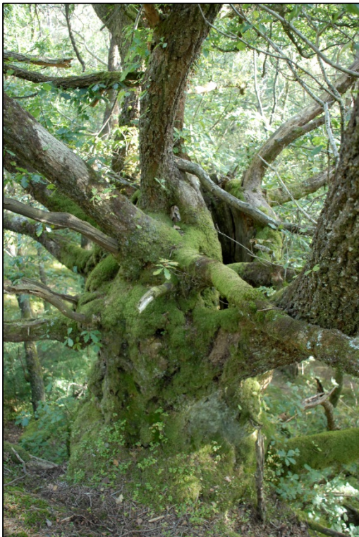
Foto: Tusenårseika er imponerende stor, og står i området som i dag er buffersona mot naturreservatet. Gamle tre av denne typen er sjeldne. De er viktige levestadar for spesialiserte artar sopp, mose, lav og insektet.

På læger/daud ved i skogbotnen i nordvest, blei råteflak og hornskovelmose funne, to artar som er regionalt sjeldne. På eik i same området veks liten praktkrinslav som er raudlista (VU-sårbar). På bjørk veks Arthonia arthenoides som krev høy luftråme og er mindre vanleg, på kristorn veks kattefotlav og på furu stubbesigdmose ein austleg art som er mindre vanleg i Rogaland.