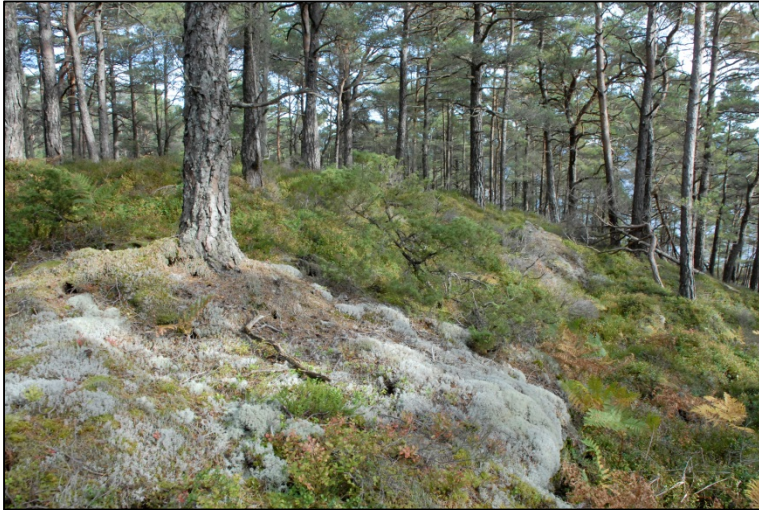
Foto: Lavrik utforming i forgrunn og bærlyngdomminert utforming bak.

Området er del av Tveitaskogen, den 2500 daa store landbrukseigedommen på Tveit jordbruksskule. Skogen på Tveitaneset har vekse opp i tida etter skulen vart starta i 1877. All tilgjengeleg skog i Ryfylke vart i praksis hogge under Skottetida (år 1500-1600). Marka vart etter dette nytta til utmarksbeite på fleire småbruk. Når landbruksskulen starta opp i 1877 vart utmarka beita mindre intensivt, og ein antar skogen etablerte seg i denne tida. Boreprøvar tatt på midten av 1980-talet underbygger dette, då dei eldste trea var 130 år gamle. Desse er truleg frøtre til majoriteten av furuskogen, som er om lag 100 år gamal (Per Helle pers.medd.)