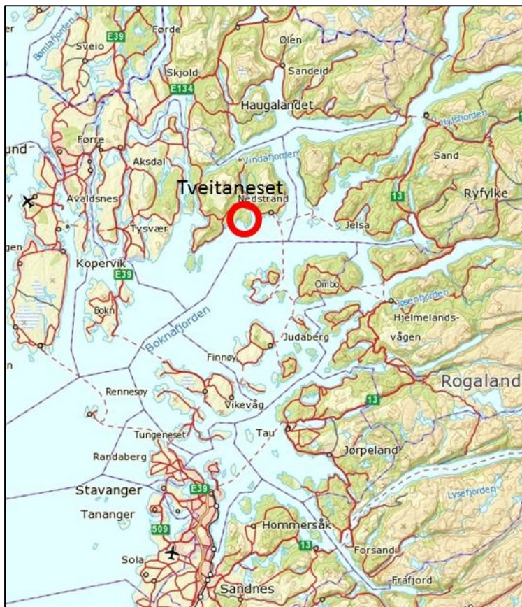
Kart: Naturreservatet markert med rød sirkel.

Forvaltningsplana er utarbeida av Fylkesmannen i Rogaland, i samband med arbeidet med utvidinga av Tveitaneset naturreservat. Den forenkla planen vil i fyrste rekke ha høringspartane som målgruppe. Etter at verneplanprosessen er slutført og området er verna vil forvaltningsstyresmakta vurdere om ein må revidera og utvida forvaltningsplan. Då vil ein vurdere nærare differensiert forvaltning, informasjon, skjøtsel og målretta bevaringsmål etter nasjonal standard.