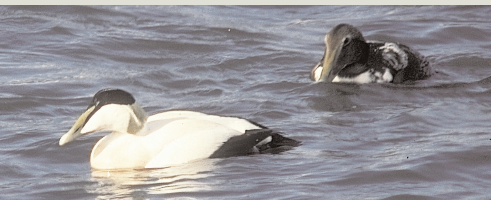
Ærfuglen sine fjør har gitt varme i sengene til folk.

Nausta langs kysten er viktige kulturminne som spenner over lange tidsrom. Ved vegen aust på Regestranda ligg ei forhistorisk nausttuft som vitnar om strandkanten i tidlegare tider, medan naustet lengst i vest er eit nyare kulturminne. Siste verdskrigen har late etter seg mange krigsminne som bunkersanlegg og skyttarstillingar vest på Regestranda og ved Strandhotellet.