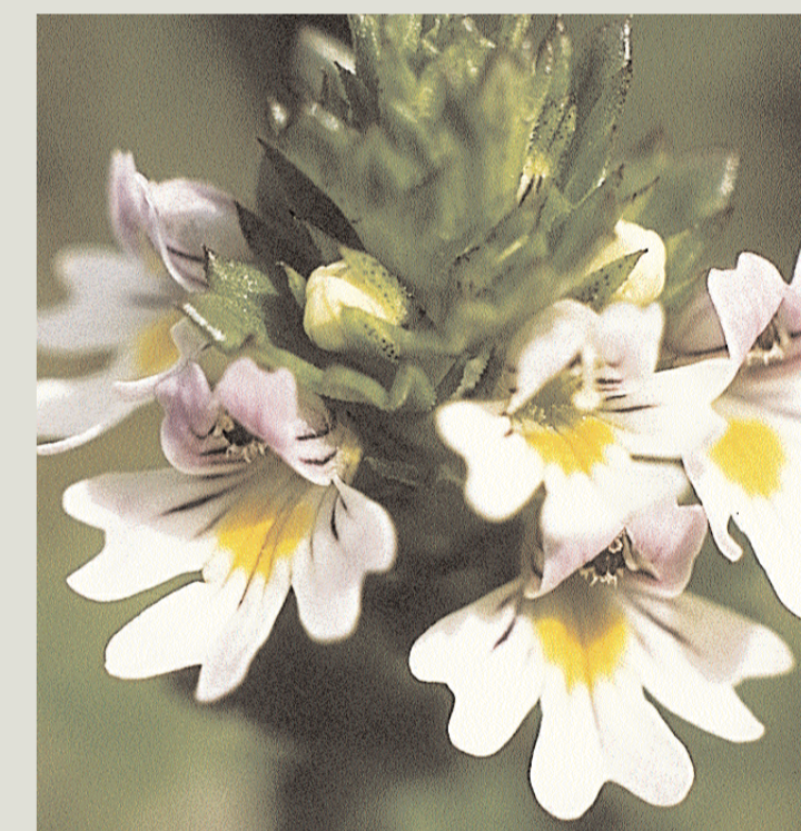
Øyentrøst - liten og nydeleg, vokser på ugjødsla beitemark.