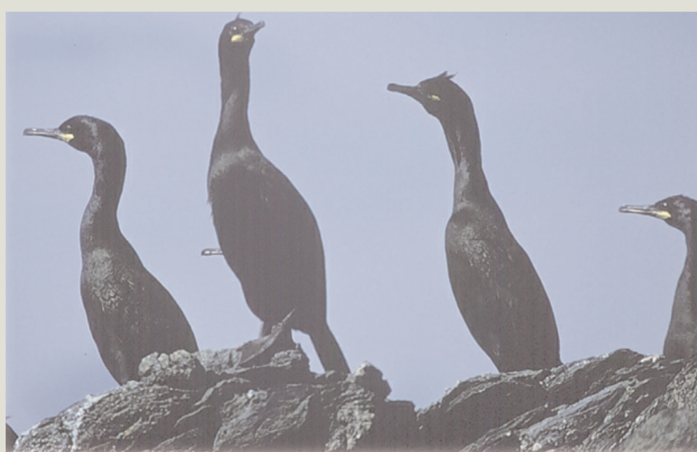
Toppskarv – ser du fjørpnyden på hovudet ?