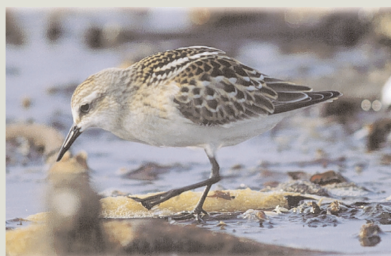
Dvergsnipe – kjappfota spirrevipp på trekk.