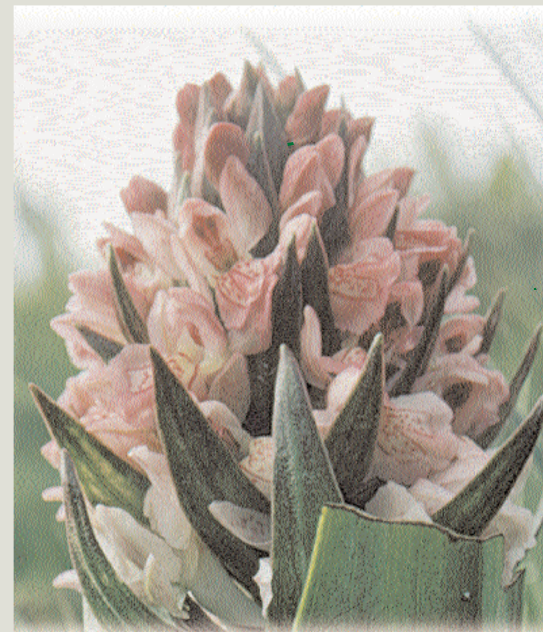
Augnetrøst – liten og nydeleg, veks på ugjødsla beitemark.