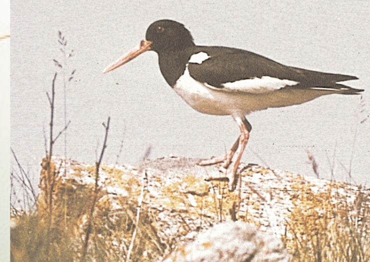
Tjelden – kysten sin nasjonalfugl med sine raudfarga knesokkar og nebb.

Das Landschaftsschutzgebiet Jærstrendene wurde 1977 unter Schutz gestellt, um eine einzigartige Natur- und Kulturlandschaft mit charakteristischen Strandtypen zu bewahren. Das Gebiet mit einer Nord-Süd-Ausdehnung von ca. 70 km und einer Fläche von ca. 17 km 2 zeichnet sich durch besondere geologische, botanische, zoologische und kulturhistorische Werte aus. Ca. 25 km dieser Küstenlinie umfaßt Sandstrand mit Dünen, der Rest ist Geröll- und Felsküste. Es sind 8 Vogelschutz-, 10 Pflanzenschutz- und 4 Naturschutzgebiete gesondert ausgewiesen. Große Teile des Schutzgebietes sind in Privatbesitz, es ist jedoch gestattet, den Strand für Freizeitaktivitäten wie Wandern und Baden zu benutzen. Verhalten Sie sich bitte rücksichtsvoll!"