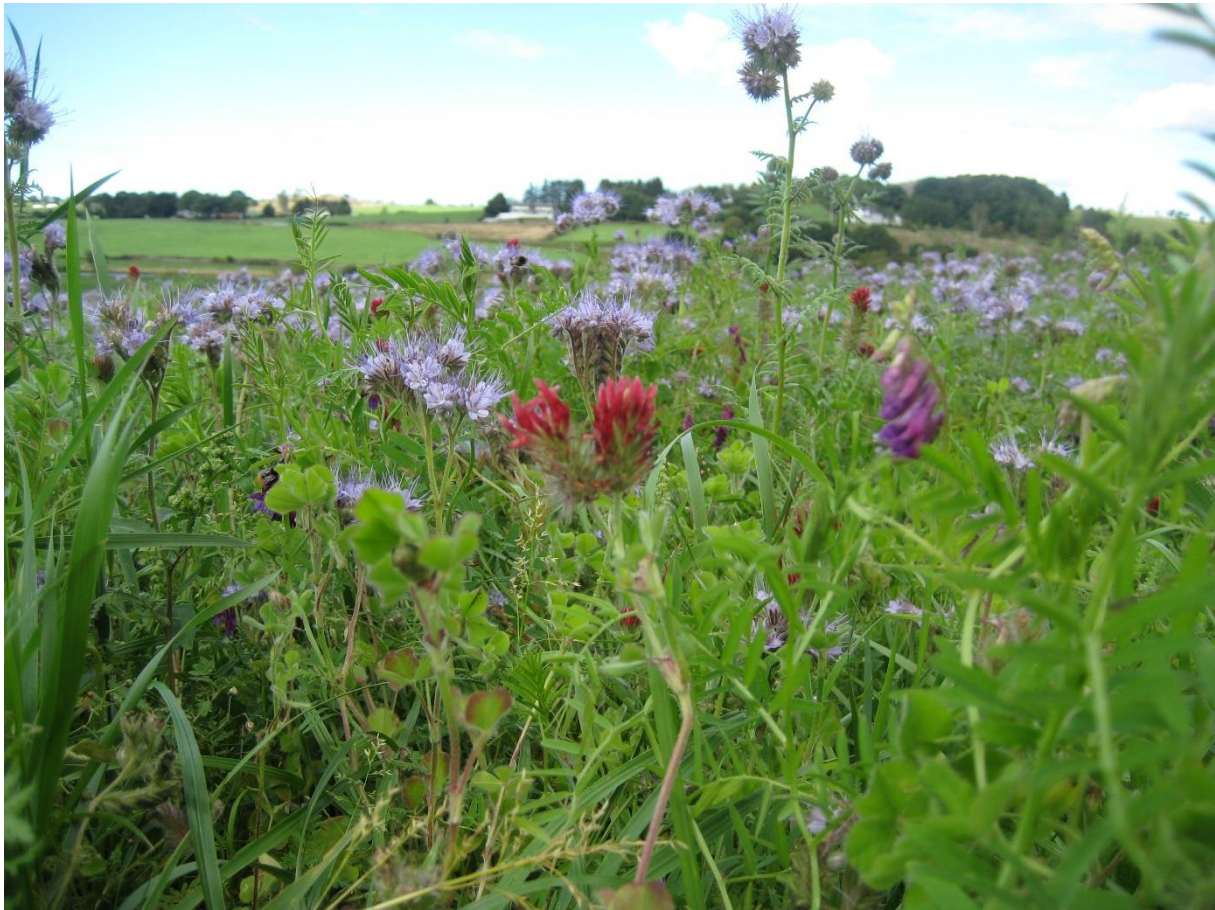
Figur 2: Blomar frå ein pollinator-vennleg sone.