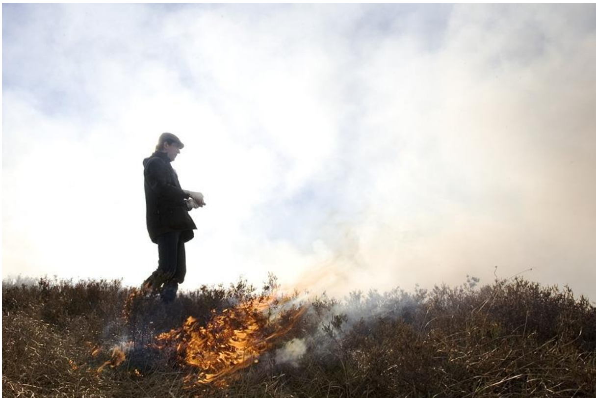
Figur 1: Brenning av kystlynghei er ein viktig del av skjøtselen som bevarer denne naturtypen.