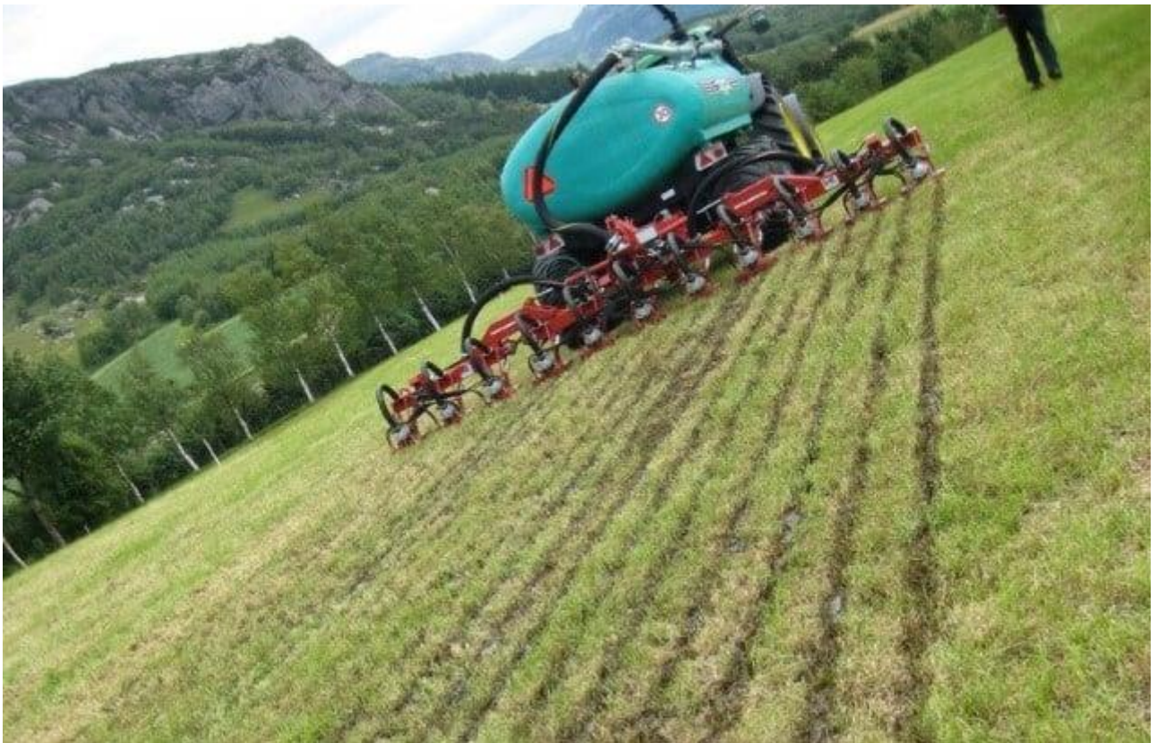
Figur 5: Miljøvenleg gjødselspreiing

Om lag 85 prosent av fosforet som blir tilført jordbruksareala i Rogaland kjem frå husdyrgjødsel. I Rogaland er miljøvenleg gjødselspreiing òg eit viktig tiltak for å minske næringstap til vassdrag.