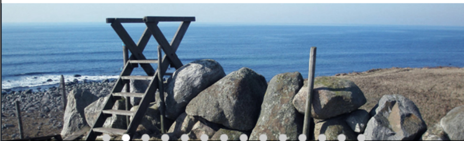
Gjerdekyvar er naturleg del av jærsk jordbrukslandskap