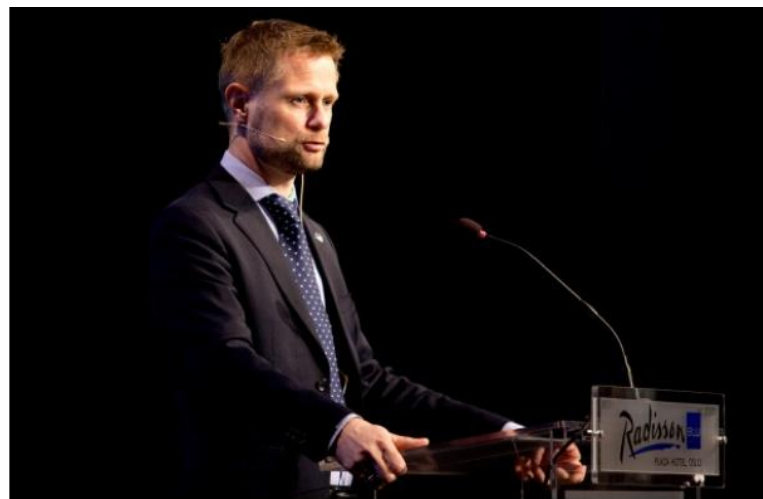
Vi har snakket mye om varme hender. Vi må snakke mer om kloke hoder, sa helse- og omsorgsminister Bent Høie (H) på Helsekonferansen 2015 i morges.

Her presenterte han flere nyheter fra regjeringens stortingsmelding om primærhelsetjenesten, som offentliggjøres etter statsråd i dag. Blant annet vil regjeringen gjeninnføre profesjonskrav til kommunene, slik at alle fra 2020 må ha både lege, sykepleier, fysioterapeut, jordmor, helsesøster og psykolog. Det skal innføres en egen finansieringsordning for kommunepsykologer i årene før 2020.