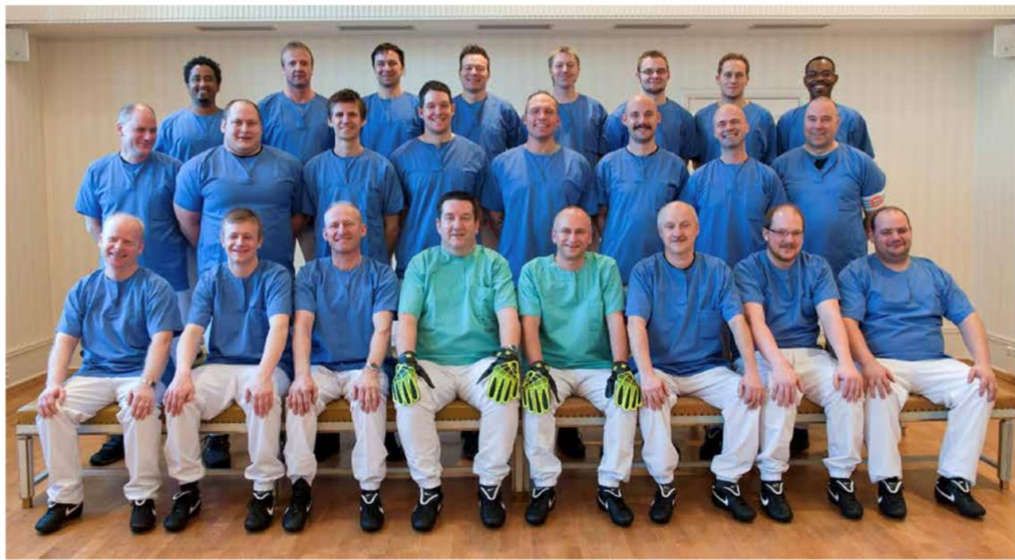
MANNSLAGSTROPPEN: Helsefagarbeidere i Trondheim kommune samlet til et lagbilde som få offentlig ansatte i Norge trolig kan vise maken til.

– Jeg likte veldig godt de som gjorde for, men det å være med på prosessen og å få tilbaketilbakemeldinger fra dem gir ting en annen verdi, avslutter Frønes.