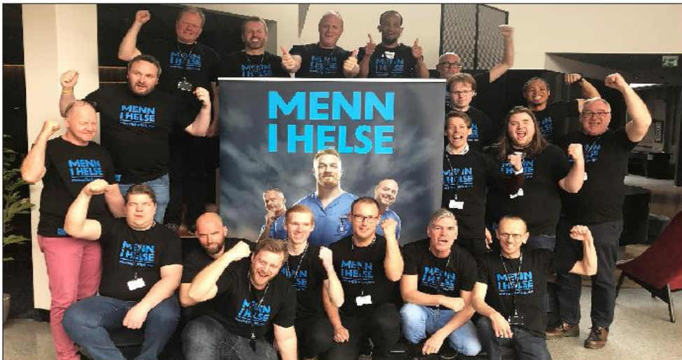
KICK OFF: 2018-kullet i menn i helse Buskerud er klare for sin mest fagbrev.