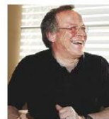
OPTIMIST: Statsråd Lars Peder Brekk

Rovviltforliket gir klare føringer for forvaltningen. Nå må det praktiseres likt over hele landet.