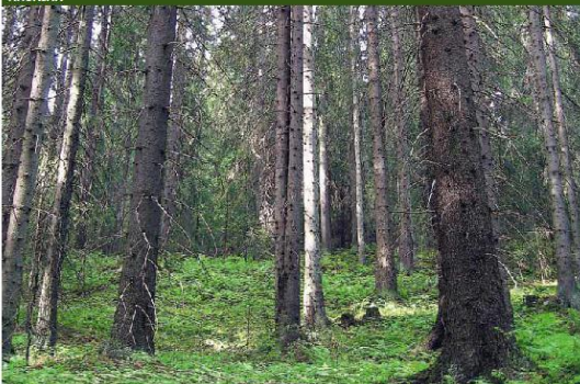
Klimaskog: Det fornyelige skogstypet er viktig for skogsmarkering i Trøndelag, og et mål for myndighetene, skriver artikkelforfatteren. FOTO: ARNE I. LARSEN. NERSH 108/12/10 FOR SDOG/OLAV LANGRANG