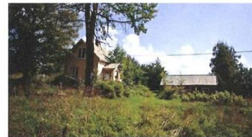
Det lille gule huset må vike for et stort bygg, hvis Vestre Toten kommune ikke snur, for å bevare en utvalgt naturtype.

– Må vurdere om verdifull natur går tapt