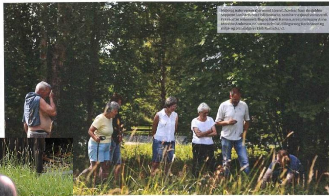
Naboer og naturvernere er forvildet av planene til å bygge ut slåttemarken. De mener det er viktig å bevare naturen og kulturlandskapet.

Men naboenes til Vestbakken kan ikke se hvilke samfunnsinter- esser som er i spill.