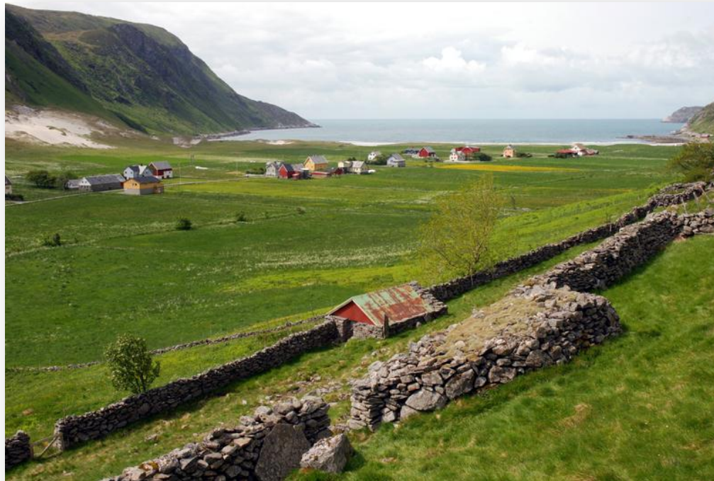
Hoddevik-Liset på Stadt, Selje, Sogn og Fjordane