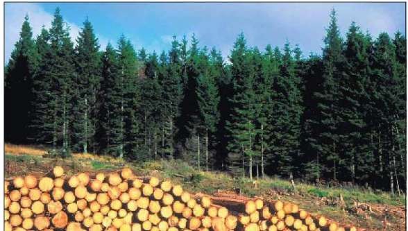
MILJØREDAKTØR: ARNE LØBERG.

NYHETSREDAKTØR: ANNE-MARIE VOLLSTAD, POLITIKKREDAKTØR: JOHN A. BRELMOEN, MILJØREDAKTØR: VIKTOR STRANDHAGEN, UTVEIINGSREDAKTØR: HILMA FRØSTAD, SPESIALREDAKTØR: ANNE-MARIE VOLLSTAD, MILJØREDAKTØR: ANNE-MARIE VOLLSTAD