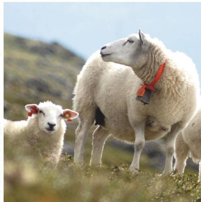
LITT MER FRED: Rovviltforliket gir grunnlag for mer fred i utmarka, mener landbruks- og matminister Lars Peder Brekk.

LILLEHAMMER: - Rovviltforliket gir grunnlag for reduserte konflikter mellom de ulike interessene, reduserte tap og øke forutsigbarhet. Det forventer vi også, sier landbruks- og matminister Lars Peder Brekk til G2.