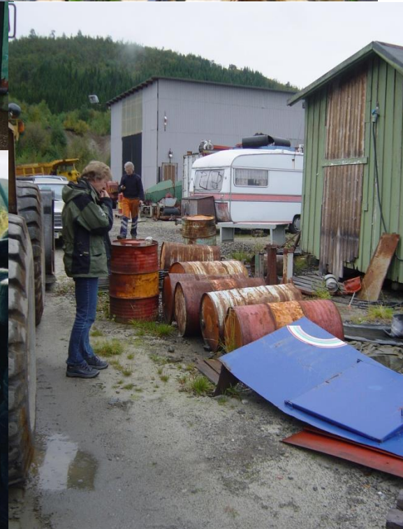
-virker for Nordlands beste