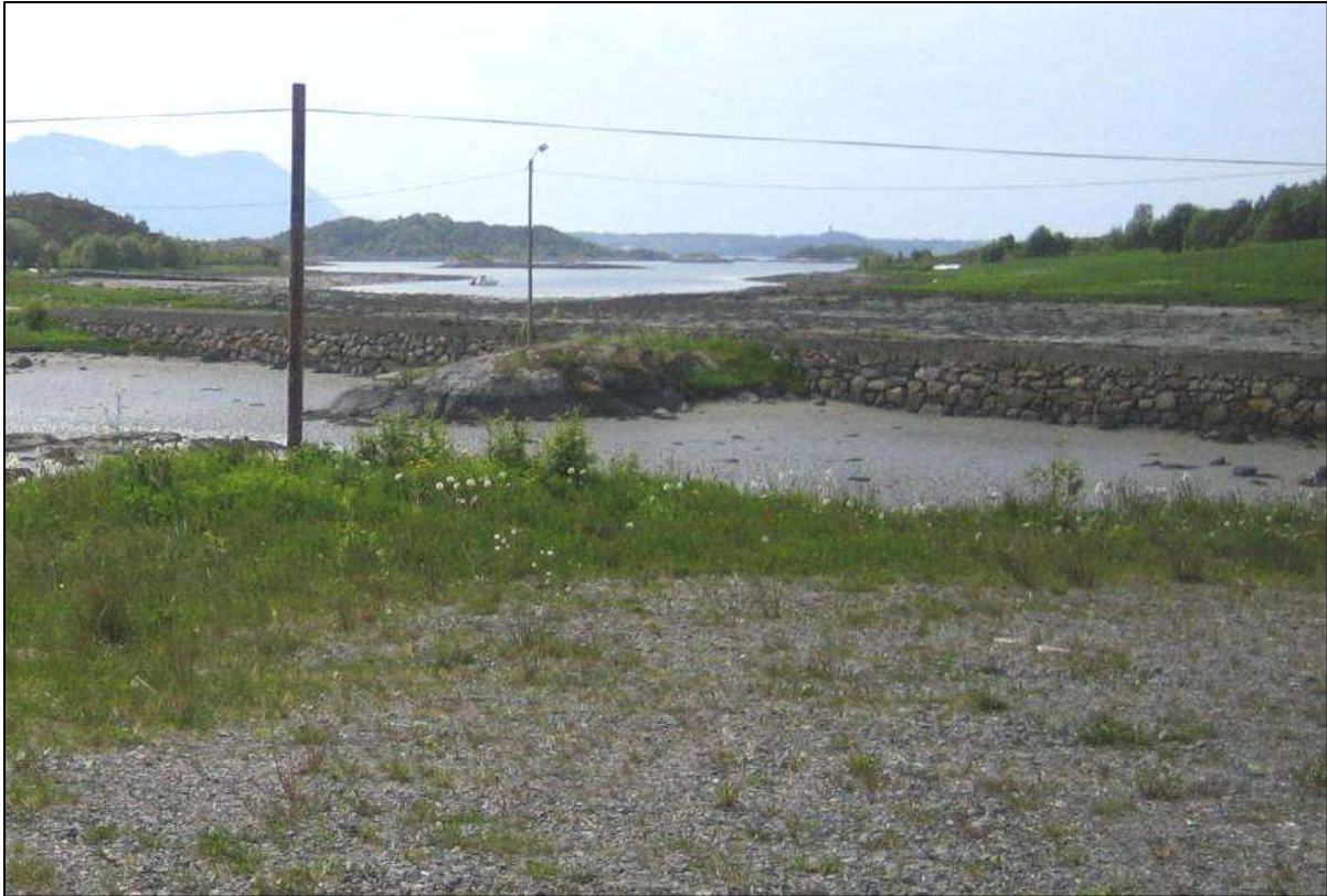
Fig. 6. Valen er delt av vegen til Vågøya, med fylling, fast dekke, gatelys og telefonline.