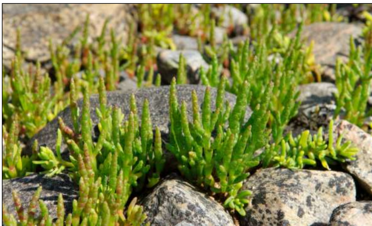
Fig 3: Salturt har fleire førekomstar i reservatet

Fræna kommune kartla naturtypene i kommunen i 2004 (Jordal 2005). Avgrensa lokalitetar blei sorterte og verdsette etter naturtype på ein skala frå A – C (A=svært viktig, B=viktig, C=lokalt viktig), der Langøyvågen blei klassifisert som Havstrand/kyst med verdi A.