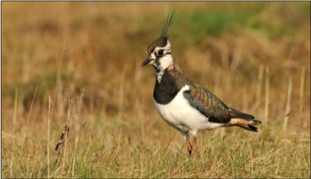
Fig. 4. Vipa kan framleis observerast på strandengene i Langøyvågen

med stor botanisk variasjon, der strandengene mest består av undervassenger, salt- og brakkvassenger. Dei store førekomstane av salturt gjer at området også er ein spesiallokalitet for denne strandtypen.»