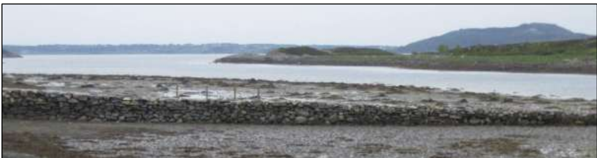
Fig. 7. Det er ein molo i vestre del av Valen