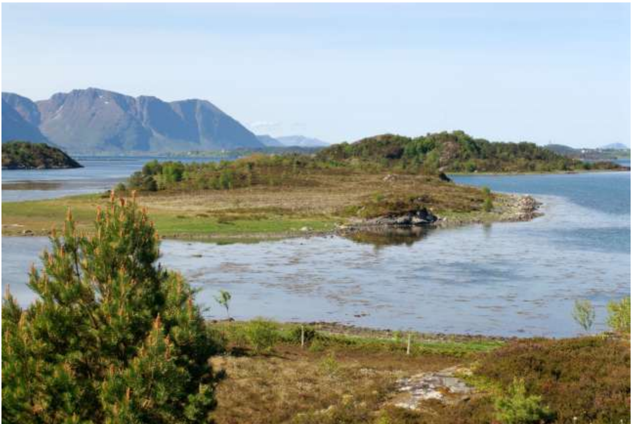
Fig. 8. Mot Langøya

Forvaltingsplanen for Langøyvågen naturreservat gjeld fram til ny forvaltingsplan er vedtatt. Fylkesmannen er ansvarleg for revideringa av planen. Ein tek sikte på å gjere dette ca. kvart 10. år, første gong ca. 2020. Fylkesmannen kan revidere planen på eit tidligare tidspunkt om det er nødvendig. Bevaringsmåla vil bli reviderte i samsvar med nasjonale standardar når desse føreligg, uavhengig av rulleringa av forvaltingsplanen.