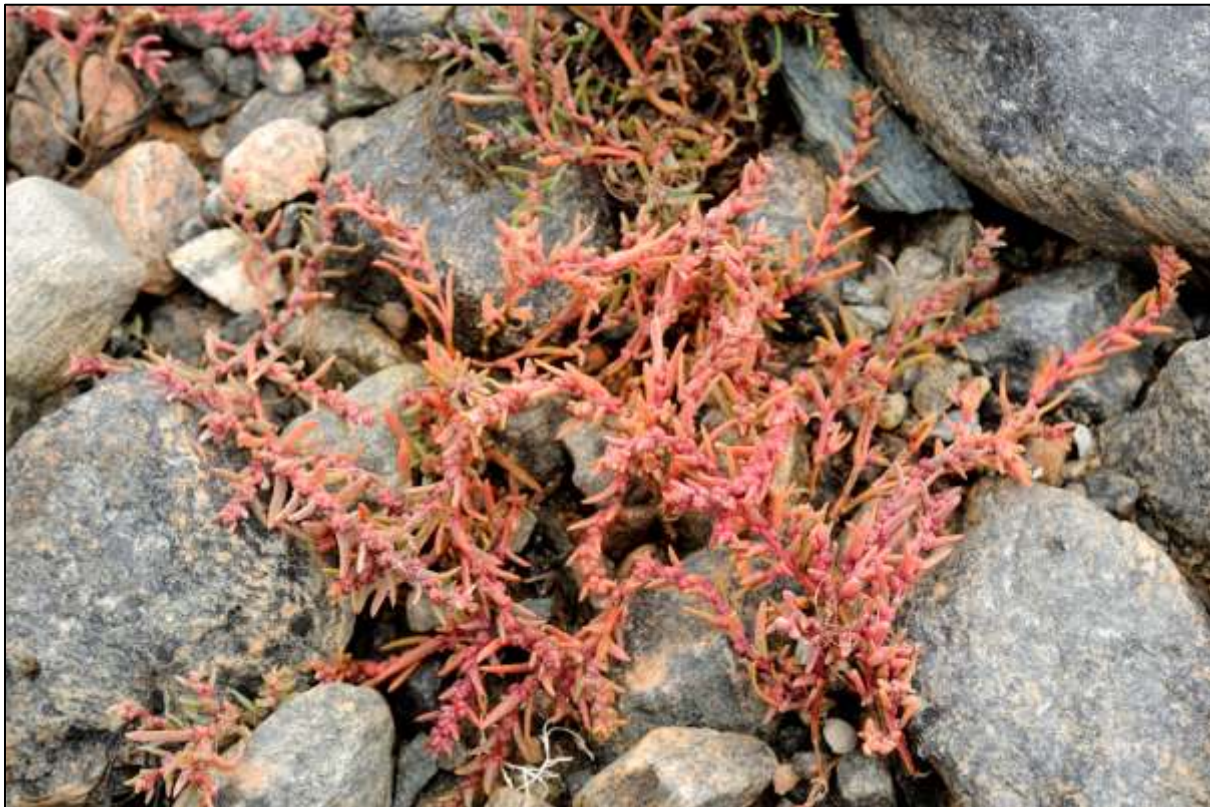
Fig. 3. Saftmelde finst på ein lokalitet på Langøya

Naturreservatet er artsrikt med ca. 70 registrerte planteartar. Interessante artar er småhavgras, ishavsstorr og dei store bestandane av salturt. Det veks svartor i stranda (Jordal 2005). Her er påvist ein lokalitet med saftmelde (Asbjørn Børset, pers. oppl.)