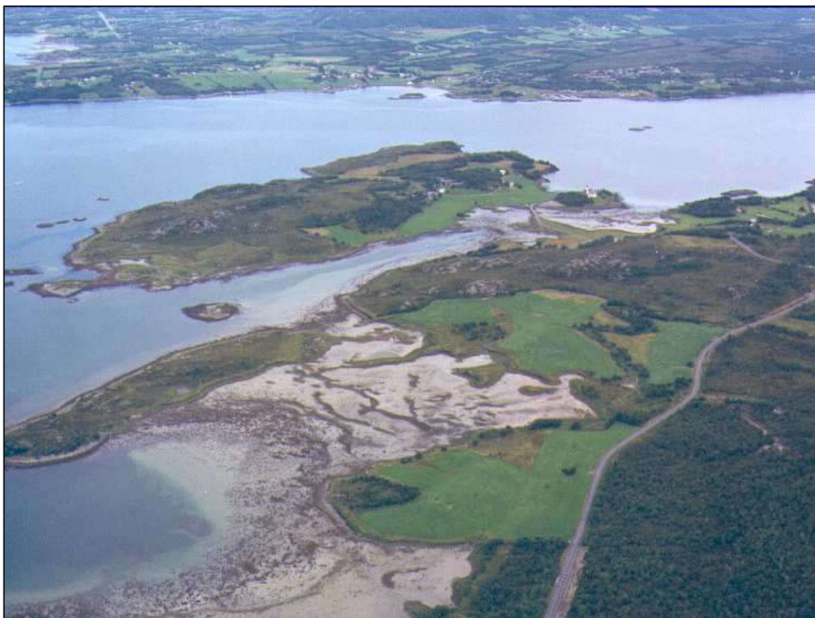
Fig 2. Store delar av sundet og bukta fell tørt ved fjære sjø, her sett frå sør-vest.