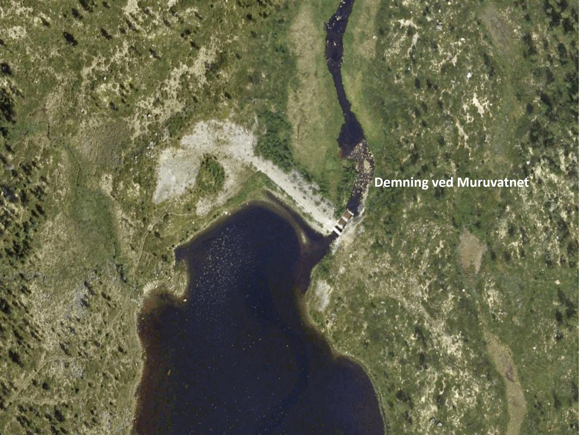
Demning ved Muruvatnet