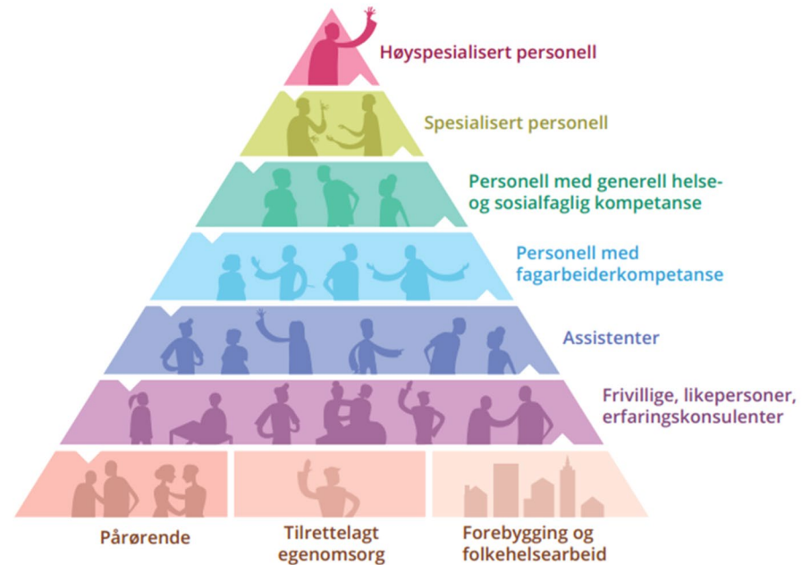
Figur 8.2 Skjematisk fremstilling av oppgavedeling, bygd nedenfra

Personellet i en bærekraftig helse- og omsorgstjeneste