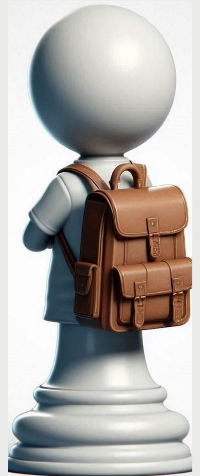
Foto: KI-generert illustrasjon