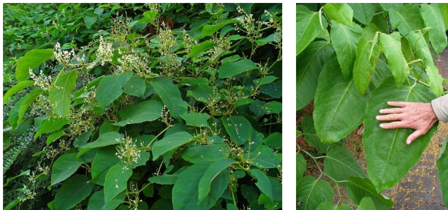
Figur 3-3: Parkslirekne (venstre) og kjempeslirekne (høyre).

Slirekneartene parkslirekne ( Reynoutria japonica ; tidligere Fallopia japonica ), kjempeslirekne ( R. sachalinensis ) og hybridslirekne ( R. x bohemica ) danner store og tette bestander som truer all vegetasjon. De formerer seg vegetativt på nitrogenrik jord, og sprer seg med flytting av masser i anleggsvirksomhet eller dumping av hageavfall ved veganlegg, turveier og ellers i by- og tettstedsnære områder. Artene står på den internasjonale lista som en av de 100 verste fremmede artene, og er vanskelig å bekjempe. Alle tre arter er klassifisert som svært høy risiko (SE) i Norsk svarteliste 2012.