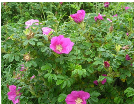
Figur 3-2: Rynkerose.

I tillegg til direkte spredning fra hager (hageavfall), sprer rynkerose ( Rosa rugosa ) seg med flytende nyper til strandområder. Spredning med fugl er også sannsynlig, men omfanget er uvisst. Arten sprer seg vegetativt i strandområder og kan her bli helt dominerende over store arealer. Rynkerose står på en internasjonalt liste som en av de 100 verste fremmede artene, og er vanskelig å bekjempe. Den er klassifisert som svært høy risiko (SE) på Norsk svarteliste 2012.