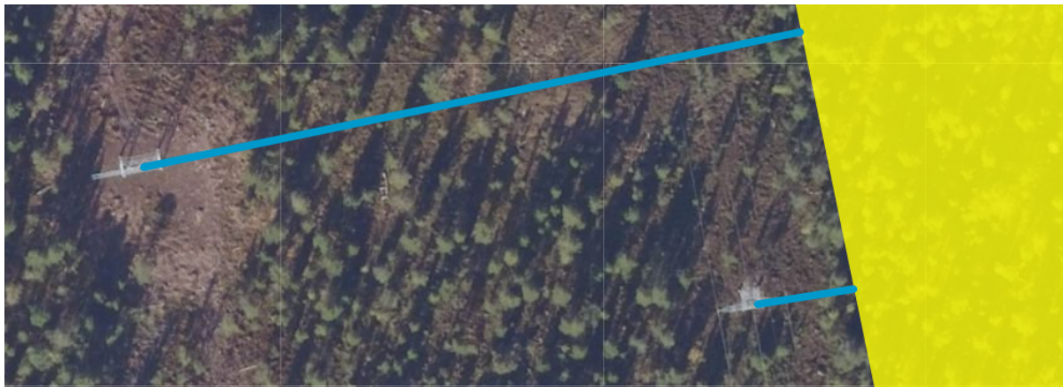
Figur 7 Nærbilete frå vest i Frønningen kandidat område for skogvern. Det gule er verneområdet, og nærast parallelt går dagens linje med 300 kV, der ser ein kablane gjennom lufta. Parallellen i vest er den nye linja med 420 kV, der er ikkje kablane strekt enno, men traseen er rydda. Dei blå linjene er avstandsmålingar, med hhv 175 og 25 meter til verneområdegrensa.

Etter innspel frå Statnett har vi inkludert standardformuleringar om kraftlinjer i verneforskrifta og lagt inn ein bisetning som skal gjere det enklare også å fjerne kraftledning som ikkje lengre er i bruk.