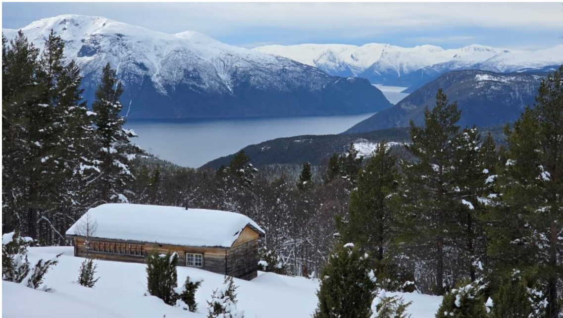
Figur 2 Nervedalen ligg inne i det tilrådde naturreservatet på Frønningen og blir ofte brukt i samband med jakt. Dagens hytte vart bygd i 1993.

Det er enkelte stiar i området, men det er relativt lite ferdsel i kandidatområdet. Ein sti går langs Bleieskaret mot Bleia og kryssar elva to gonger her. Det kjem folk årleg både sommar og på ski vinterstid over frå Lærdal/Vindedalen ned til Frønningen eller motsett veg, men det er langt å gå og ein del logistikk som skal klaffe. Truleg er det bygdefolk, jegerar og dyr som nyttar stiane mest. Det er noko villvarding langs stien, disse blir rydda av grunneigar med jamne mellomrom. Det er ei hytte på Nervedalen innanfor det føreslegne verneområdet. Det er eitt bygg der i dag, sjå figur 2. Nervedalen var opphavleg ein støl, men det vart sett opp ei hytte i staden for stølen etter at stølinga opphøyrt. Hytta brann ned, men vart bygd opp att. Dagens hytte har stått der sidan 1993.