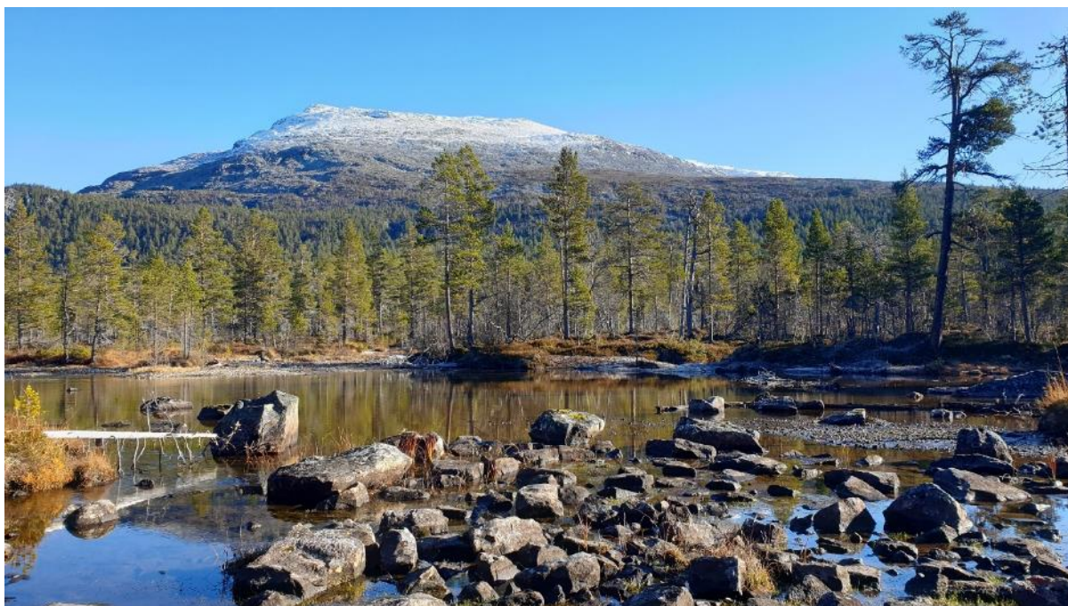
Figur 5 Tilbodsområdet for frivillig skogvern på Frønningen husar daud ved i alle nedbrytingsfasar. Data frå NTNU dokumenterer at enkelttre starta å spire allereie på 1100-talet, om lag den tida då Urnes stavkyrkje vart bygd og slaget på Fimreite avgjorde kongemakta.

Frønningen ligg i ei nordvendt li i slakt hellande terreng i den vestlegaste delen av Lærdal kommune, sør for Sognefjorden. Arealet er noko brattare i nord, ned mot fjorden, og grenser i aust mot Bleia naturreservat. I sør/søraust grenser kandidatområdet mot Bleia-Storebotn landskapsvernområde. Frønningen grensar mot Aurland kommune i sør. Arealet går frå om lag 200 til over 1000 meter over havet.