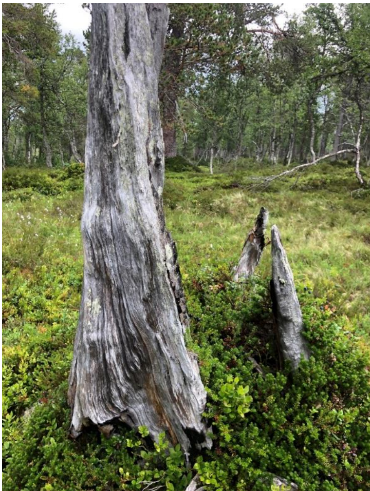
Figur 6 Brannspor kan ein sjå nedst på denne furustammen. Området vi foreslår til vern hadde brannspor på fleire gamle tre. Mange raudlista artar er avhengig av brann for å fullføre livssyklusen sin.

Det er registrert brannspor på dei eldste keloelementa (også kalt sølvfuruer) i området vi foreslår til vern. I dei høgareliggjande partia finn vi spesielt gamle furuer, og jamfør dendrokronologiske data innsamla av NTNU har enkelttre vore i vekst allereie på 1100-talet, samstundes som då Urnes stavkyrkje vart bygd. Rapporten frå NTNU er tilgjengeleg på våre nettsider. Også bjørketrea syner høg alder. Naturtypeavgrensinga er vurdert til å ha A-verdi, som tilsvarar nasjonal verdi.