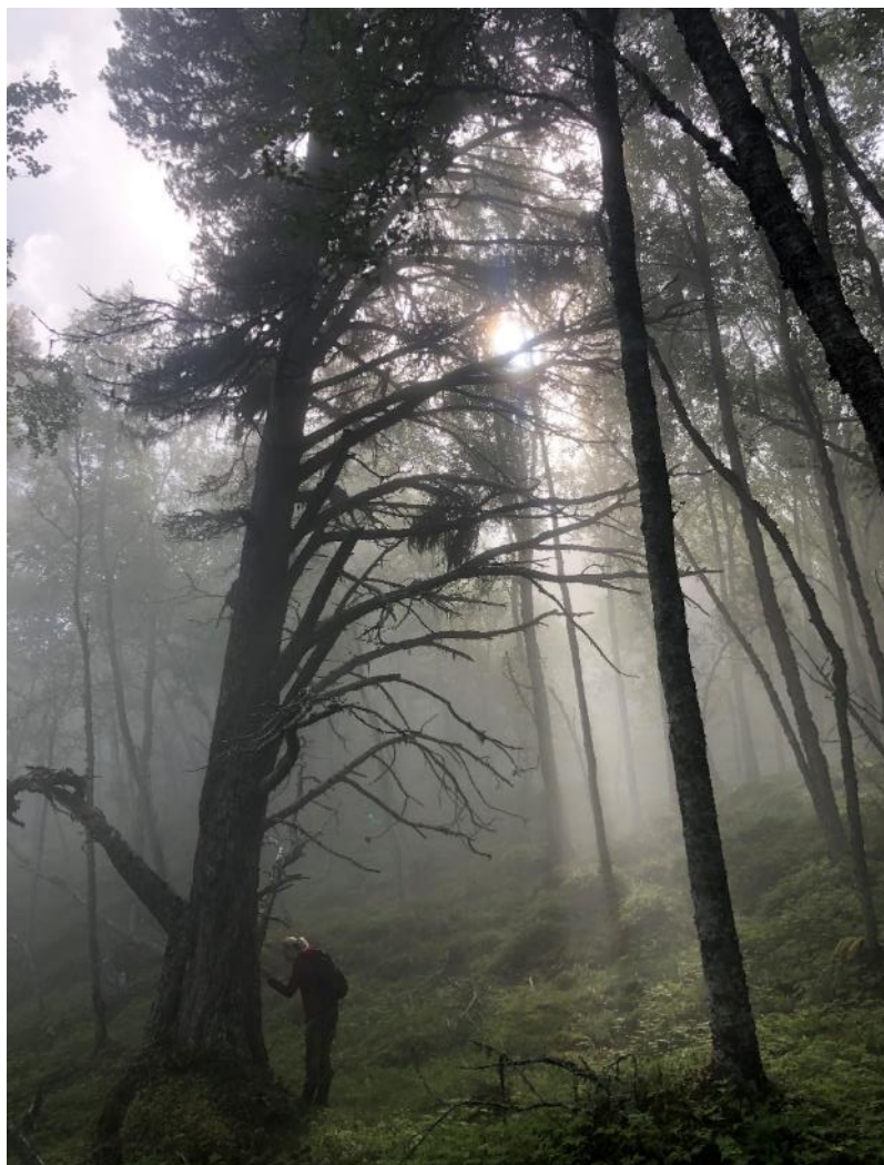
Figur 3 Store, intakte skogområde med høg alder og store tre gjev livsgrunnlag for sjeldne, truga og sårbare artar. Jo større tre, jo betre plass til ulike nisjar og artar som trivst der. Storleik er også ein viktig kvalitet i verneområde fordi store område dekker fleire nisjar og er meir robuste for omkringliggjande endringar enn små område.

Området er avsett til Landbruks-, natur-, friluft- og reindriftsområde (LNFR-område). Kartlegging av naturverdiane er gjennomført av Rådgivende biologer i samband med tilbudet om frivillig skogvern, og som har blitt lagt til grunn i kunnskapsgrunnlaget for verneplanprosessen. Bruksinteresser er klarlagt gjennom høyring av verneforslaget.