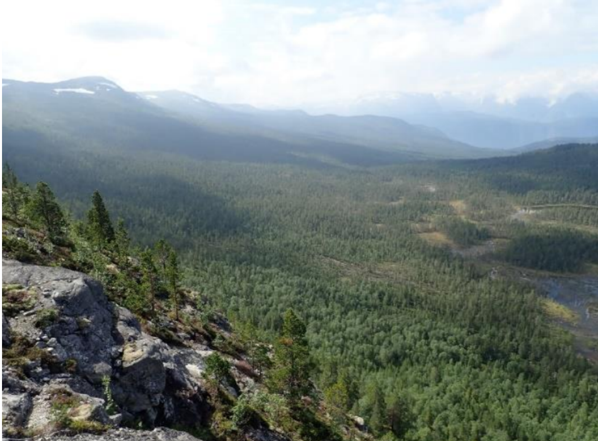
Figur 1 Vi tilrår vern av Frønningen som naturreservat. Området er uvanleg stort og vil kunne bidra til å halde området intakt og utan inngrep. Frønningen grensar til verdsarvområdet Vestnorsk fjordlandskap, Nærøyfjord-området.

karbon per hektar. Verneverdiane på Frønningen er knytt til storområdekvalitetane og den høge alderen på skogen, i tillegg husar området raudlista artar og knyter gamalskogen saman med eksisterande verneområde med verdsarvstatus. Frønningen vil kunne bidra til å fylla manglar i vernet, spesielt på store område og gamal skog, samtidig vil området vil bidra til å bevare trua og nær trua artar og halde viktige karbonlagre intakte for framtida.