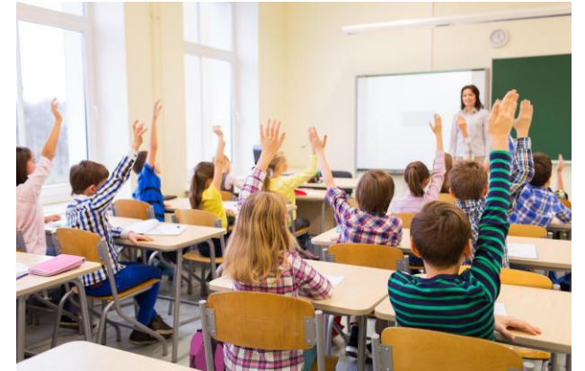
Barnehager og skoler

«Lærerutdanningsinstitusjonen og lærerutdanningskolen er kunnskapsproduserende fellesskap som videreutvikler seg ved bruk av felles fagspråk »