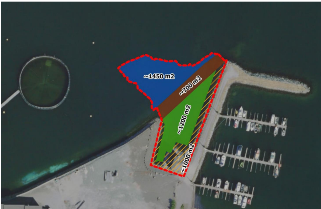
Figur 1: Kartutsnitt over eksisterande småbåthamn og utfyllingsområde. Det blå skisserte område viser fyllingsfot, brunt område illustrerer plastringsfot og det grøne området viser utfylling over sjømål.

Breivika Eigedom AS søker om løyve etter forureiningslova til utfylling i sjø med sprengstein, samt undervasssprenging. Dei ønskjer å utvide industriarealet sitt som ein del av reguleringsplanen for Breivika industriområde i Bremanger kommune. Tiltaka ligg ved ei småbåthamn og inneber utfylling av massar for landutviding til næringsføremål. I tillegg skal sprenging av sjøbotnen gjerast for å sikre geoteknisk stabilitet for fyllinga.