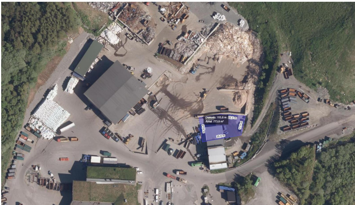
Alternativ 2: ved vaskehall.