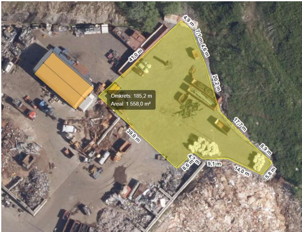
Alternativ 1: ved jern og metall.