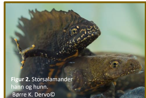
Figur 2. Storsalamander hann og hunn. Børre K. Dervo©

Amfibier i nedgang. Amfibier generelt har blitt redusert i antall arter, populasjoner og individer verden over siden 1950-tallet. Det er mange grunner til at det står dårlig til med dagens amfibier, men en av drivkreftene som gir spesielt negativt utslag er spredning av fremmede arter som i mange tilfeller gir sykdom og død for mange av artene.