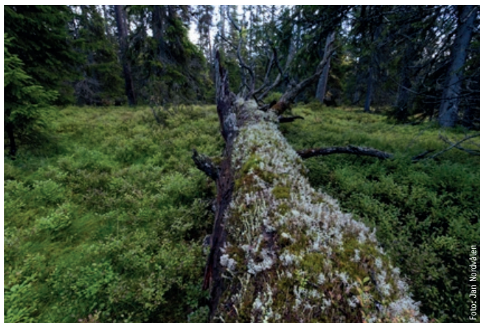
Det er mye gammel skog som får et langt liv i Gutulia nasjonalpark.