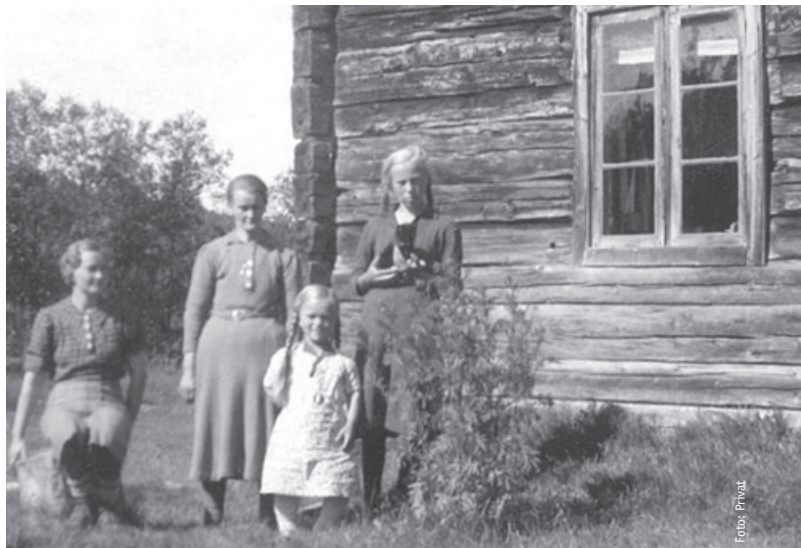
SETRING: Fra Gutulisetra (Nedpåvollen) den gang det var aktiv setring på vollen.