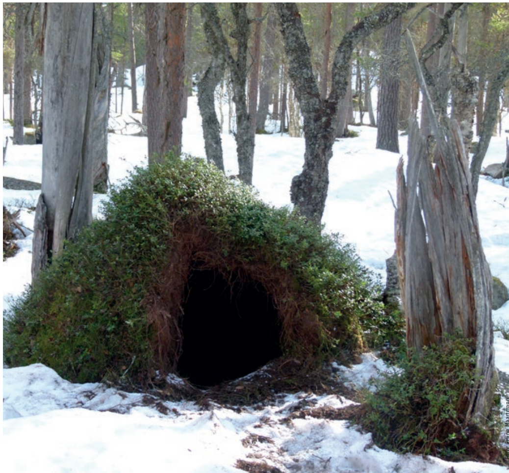
I GUTULIA: Bjørnehiet i Gutulia får sin oppmerksomhet på turen.

– Bjørnene skeier skikkelig ut og spiser seg feite på bær med høyt sukkerinnhold før de legger seg for å sove i hiet. For oss mennesker ville det være