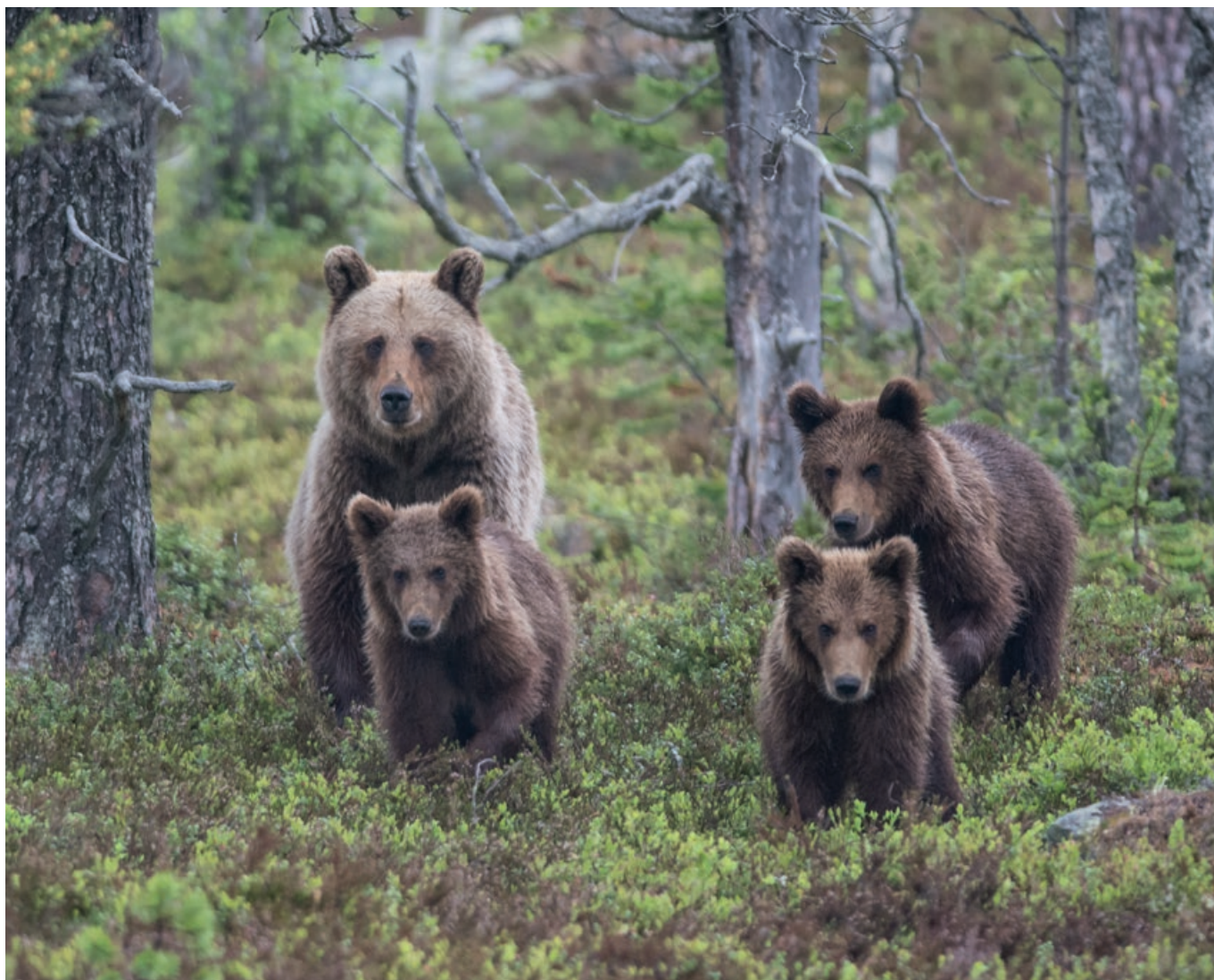
Bjørnebinne med tre fjorårsunger fotografert nordvest for Gutulivollen i Gutulia nasjonalpark i juni 2014.

Utgiver: Nasjonalparkstyret for Femundsmarka og Gutulia Juni 2018