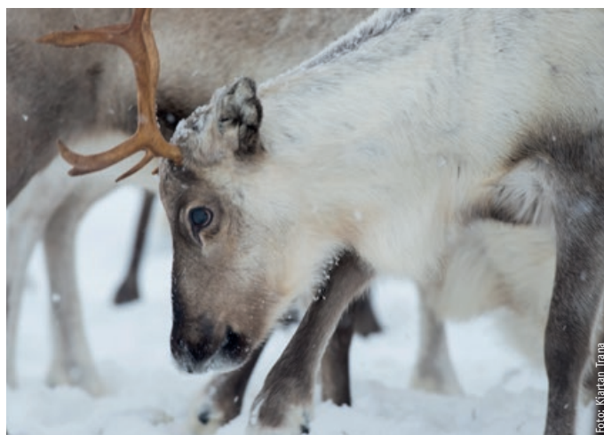
Tamrein i området.

Nå har Norge totalt 46 nasjonalparker, hvorav 39 ligger i Fastlands-Norge og sju på Svalbard.