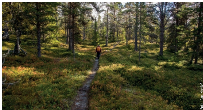
NATURSKOG: Naturskog i Gutulia nasjonalpark.

Bildene er tatt av lokale fotografer, og nasjonalparksenteret legger til forklarende tekster.