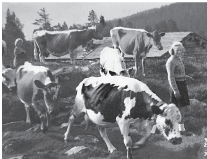
SETERLIV: Seteridyll i Gutulia er blant bildene som vises i utstillingen på Blokkodden villmarksmuseum i sommer.

– Søndag 22. juli fokuserer vi ekstra på setring og Gutulia. Da inviterer vi til en spesiell alomvisning blant annet med fokus på hvor viktig setring var for Engerdals eksistens. Litt tradisjonell seterkost vil også bli servert, opplyser hun. Blokkodden villmarksmuseum er et friluftsmuseum som viser norsk og samisk bruk av utmarka i Engerdal fra 1600-tallet og frem til i dag.