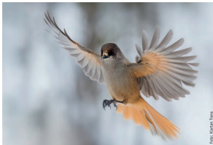
Lavskrike finnes i området.

Lov om Naturvern av 1. desember 1954 var grunnlaget for at Gutulia ble fredet ved kongelig resolusjon 20.12.1968. Staten overtok de tre Gutulisetrene; Nedpävollen, Opppävollen og Lillebovollen bestående av totalt 16 hus. Gutulia ble Norges tredje nasjonalpark. Rondane nasjonalpark var opprettet i 1962 og Børgefjell nasjonalpark i 1963.