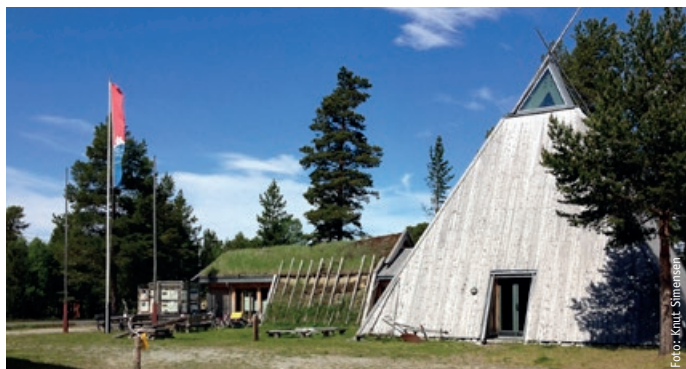
NASJONALPARKSENTERET: Besøkssenter nasjonalpark – Femundsmarka og Gutulia avdeling Elgå ligger ved den sørlige inngangsporten til Femundsmarka nasjonalpark, men er også et informasjonssenter for Gutulia nasjonalpark.

Når besøkssenteret åpner dørene for sommerseesongen lørdag 16. juni, åpnes samtidig dørene til en ny billedutstilling om Gutulia nasjonalpark.