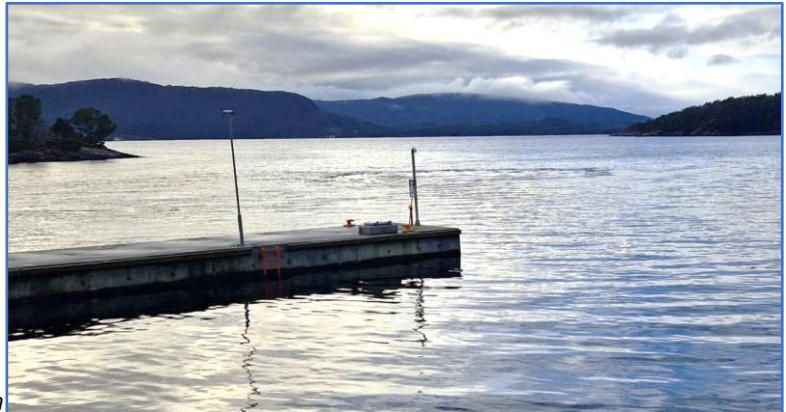
Figur 1: Gjennomslag til overflata frå utsleppspunktet ved Kvingo synleg på tilsynsdagen 28.10.2024.

opportunistiske algar (også kalla lurv). Sommarstid er hovudvindretninga frå sør og vest og vil føre til at utsleppa vil kunne bli synlege i strandsona inne i Skutevika.