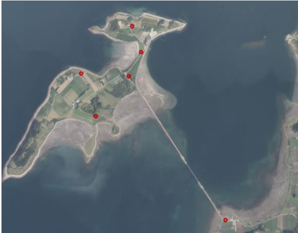
Figur 2. Informasjonspunkter for temavise plakater.