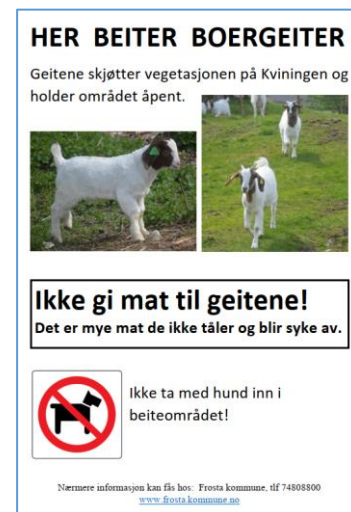
Figur 5. a) Infoplate om ærfuglhekking er oppsatt på porten ut til Åbåten. b) Plakat om beitende boergeiter er satt opp på portene på begge sider av Kviningen.