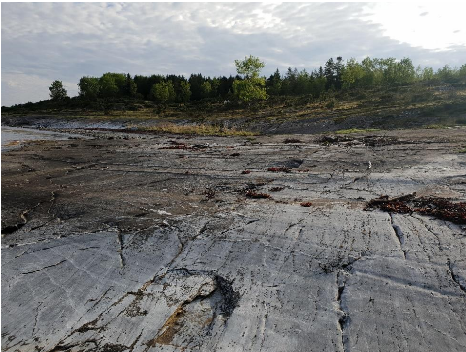
Figur 7. A-område Kviningen med kalkberg.

Også på Kviningen i nordvest er det forbud mot ferdsel i hekketiden. Ellers i året kan turen gjerne legges til dette området. Ferdsel ut til Kviningen skjer gjennom porter i strandsonen både på sør- og nordsiden. Det er ikke meldt om slitasje av vegetasjonen på grunn av ferdsel på Kviningen. Men det er viktig at bålbrekking kun foregår i fjæra og ikke på kalkberget (figur 7). Varme fra bål på berget vil føre til at det sprekker og smuldrer opp.