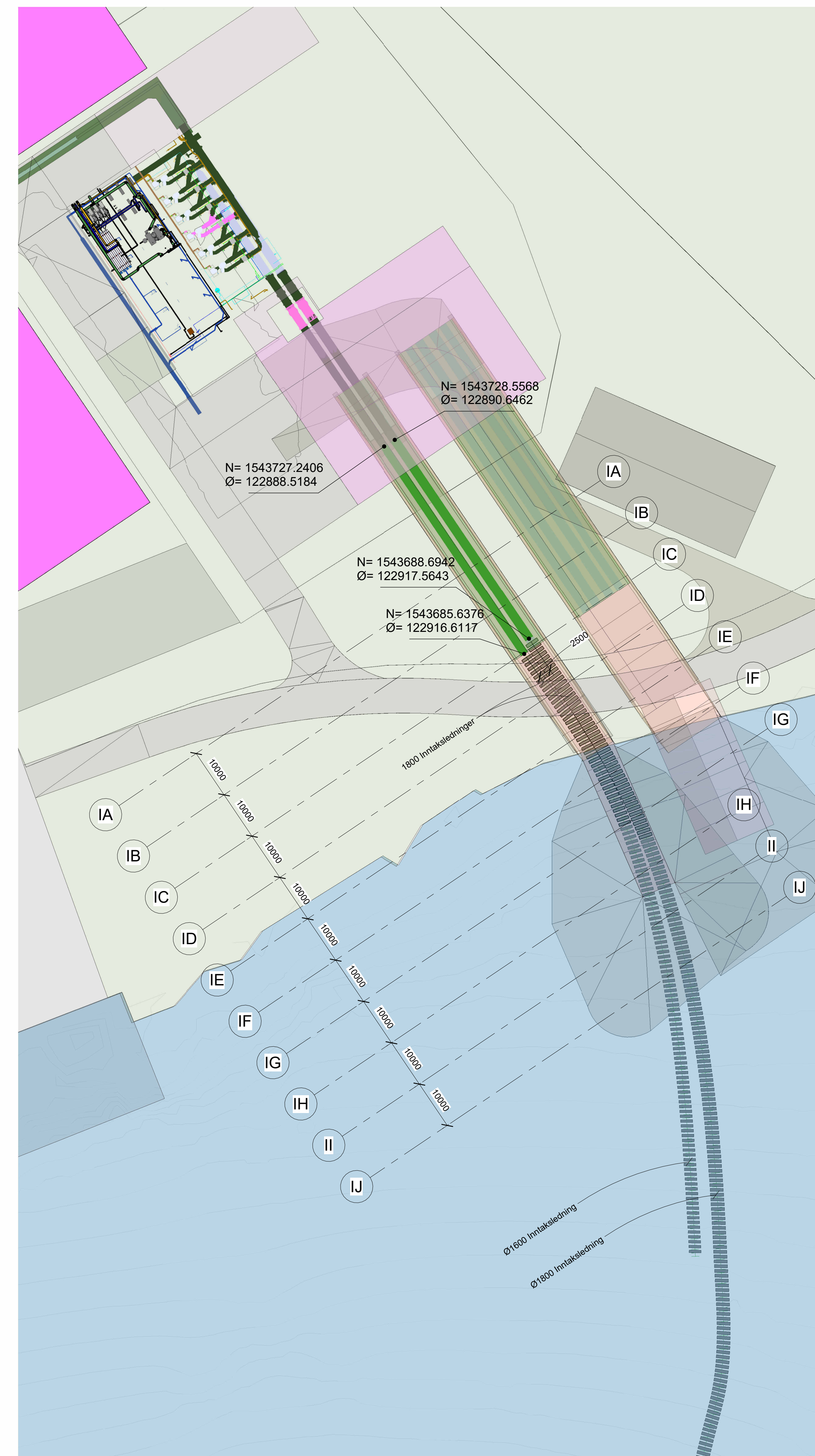
1 Sit.plan Inntaksledninger 1 : 500