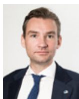
Henrik Asheim (H) FORSKNINGS- OG HØYERE UTDANNINGSMINISTER