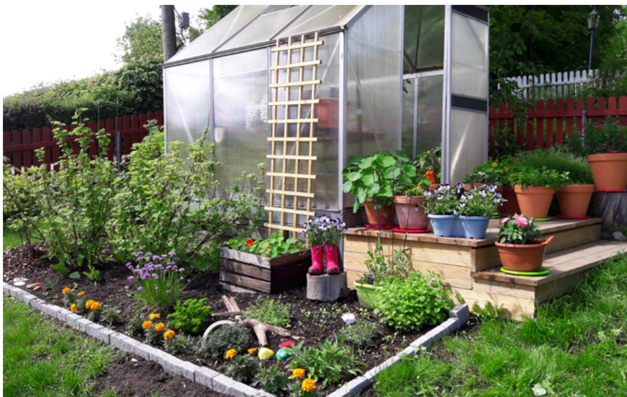
Barnehage Lier kommunen.

I tillegg til formidling av eksisterende kunnskap i samhandling mellom ulike aktører, er det behov for å utvikle ny og tverrfaglig kunnskap om bærekraftig urban matproduksjon. Forskning, utvikling og innovasjon kan bidra med grunnleggende kunnskap om dyrking i byer og tettsteder, og legge grunnlaget for verdiskaping. Norges forskningsråd, Forskningsmidlene for jordbruk og matindustri, samt SkatteFUNN, har virkemidler for videreutvikling av et kunnskapsbasert urbant landbruk. Prosjekttypen som særlig peker seg