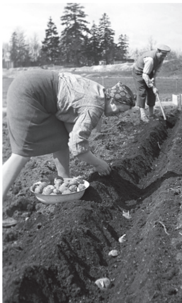
Potetdyrking på Tørtberg i Frognerparken i mai 1944.

Globalt står urbant landbruk på dagsordenen i mange land og i internasjonalt samarbeid 2 .