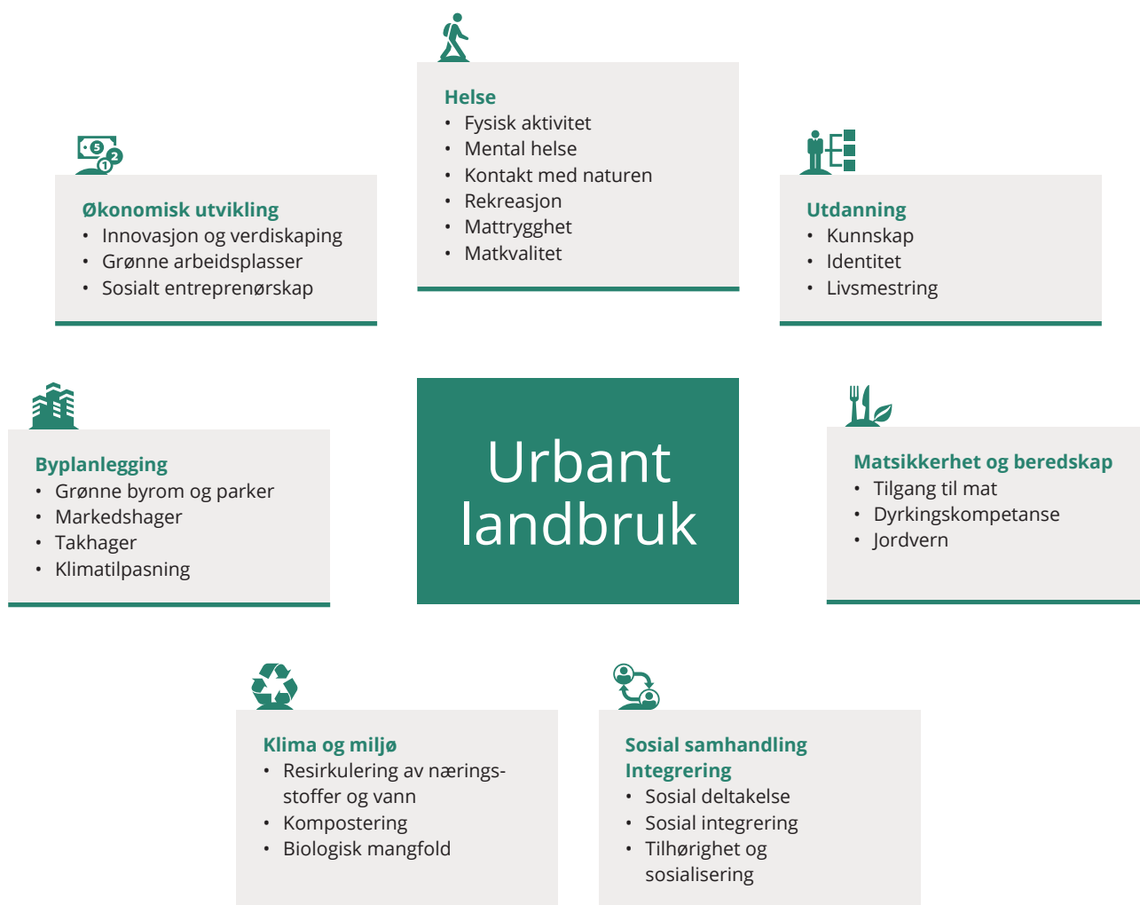
Figur 1 illustrerer hvordan urbant landbruk kan gi måloppnåelse på en rekke samfunnsområder. 6

FNs mat- og landbruksorganisasjon (FAO) mener urbant landbruk er en del av løsningen for å møte behovet for mat og ivareta klimahensyn i fremtiden 5 . FNs 2030-agenda setter ambisiøse mål for bærekraftig utvikling som balanserer økonomiske, sosiale og miljømessige hensyn. Urbant landbruk kan bidra til å nå flere av bærekraftsmålene også i Norge. Strategien legger bærekraftsmålene til grunn, og bygger på nasjonale målsettinger innenfor flere politikkområder. De mest relevante nasjonale målene er innen by- og stedsutvikling, landbruk, helse, sosial, integrering, utdanning, klima og miljø. Sektorpolitikken er forankret i en rekke stortingsmeldinger.