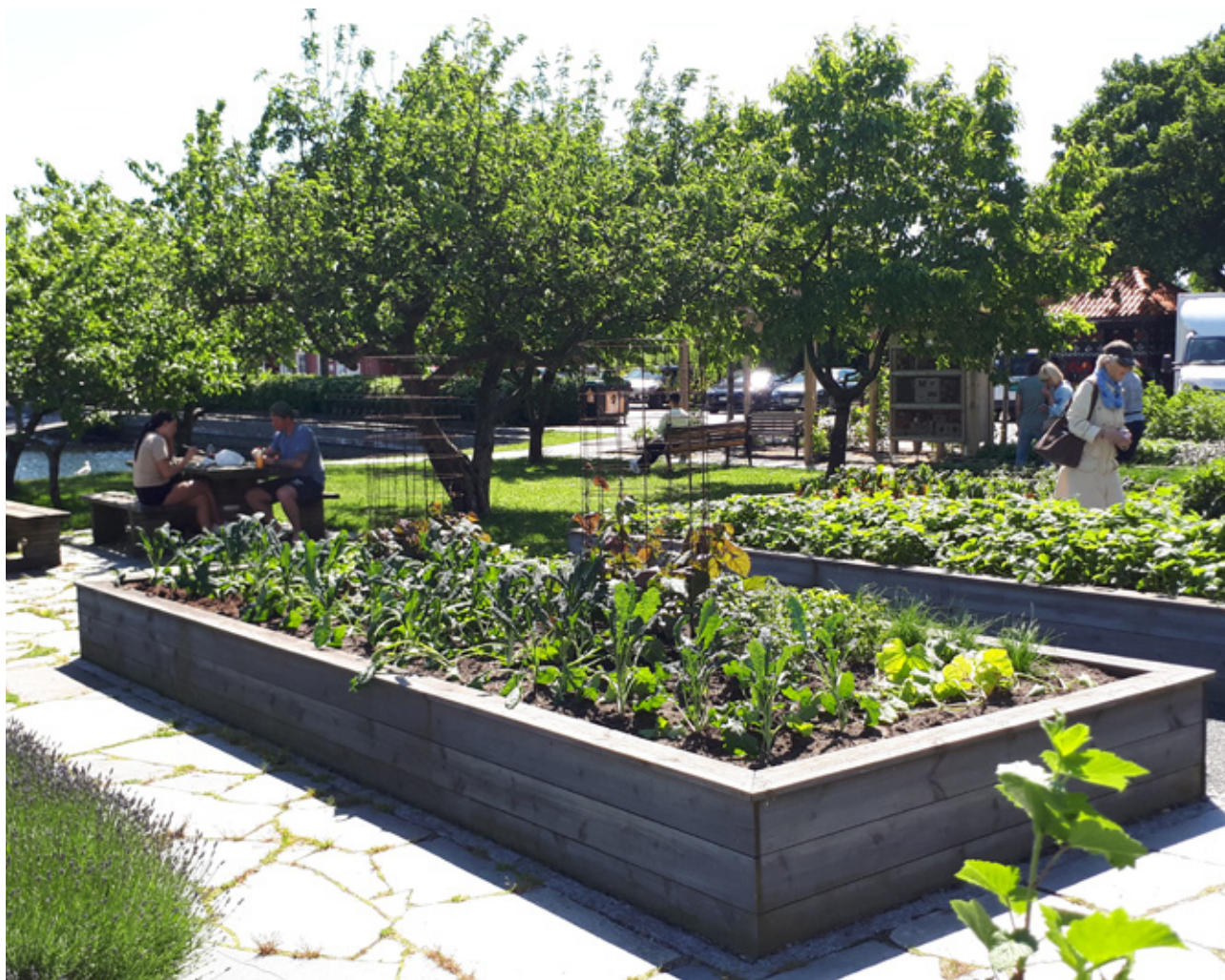
Tidlig sommer i Kristiansand.

Flere grønne arealer og økt arts mangfold gir insekter både levesteder og muligheter for å spre seg mellom større naturområder. Urbant landbruk i form av beitedyr og tradisjonell høyslått bidrar til å restaurere og holde i hevd artsrike naturtyper som beitemark og