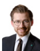
Sveinung Rotevatn (V) KLIMA- OG MILJØMINISTER