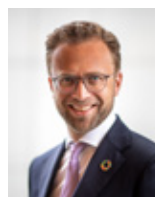
Nikolai Astrup (H) KOMMUNAL- OG MODERNISERINGSMINISTER