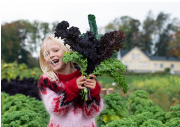
Grønnkålshøsting Århus gård, Skien.

Skolehager kan også være en egnet arena for fysisk aktivitet i skolehverdagen. Det er barnehagene og skolene som velger hva slags metoder de tar i bruk.