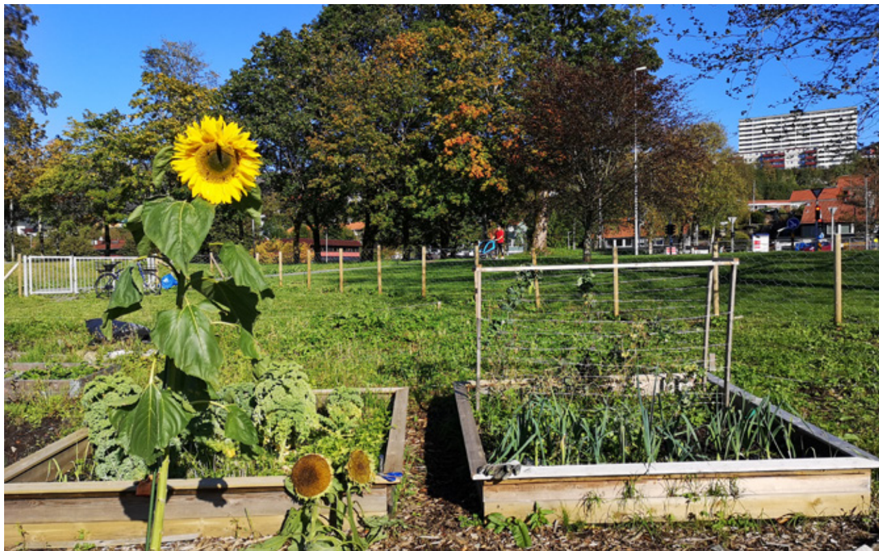
Stortveitmarken parsellhage i Bergen – sneglegjerde på pallekarmen.

Den økte interessen for urban dyrking, og det faktum at mange ikke har et sted å dyrke, gjør at etterspørselen etter parseller, og ønsket om å utnytte restarealer øker. Det er mange arealer som ligger ubrukt. Det kan være uavklart hva arealet skal brukes til, eller at eier ikke har tatt arealet i bruk. Midlertidig dyrking på slike arealer er bærekraftig bruk av ressurser, og er gjennomført mange steder.