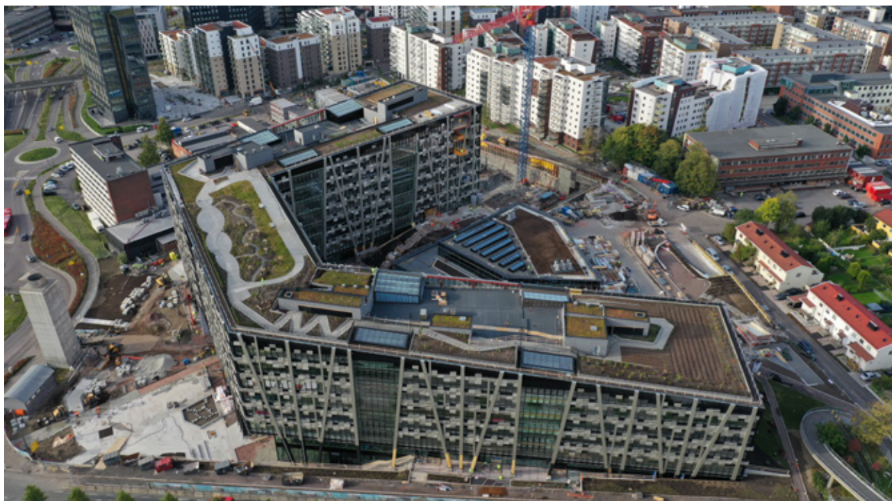
Økern Portal, Nord-Europas største takpark på syv mål (7000 m 2 ) med parsellhager, bikuber og friluftsområder. Her skal barn og voksne få lære om dyrking og sirkulære kretsløp. Avfall fra bygget skal komposteres og brukes som gjødsel.

Bygninger og asfalt lagrer varme, og bidrar dermed til å øke overflatetemperaturen i urbane områder. Innslag av grønt bidrar til å redusere mengde asfalt og harde