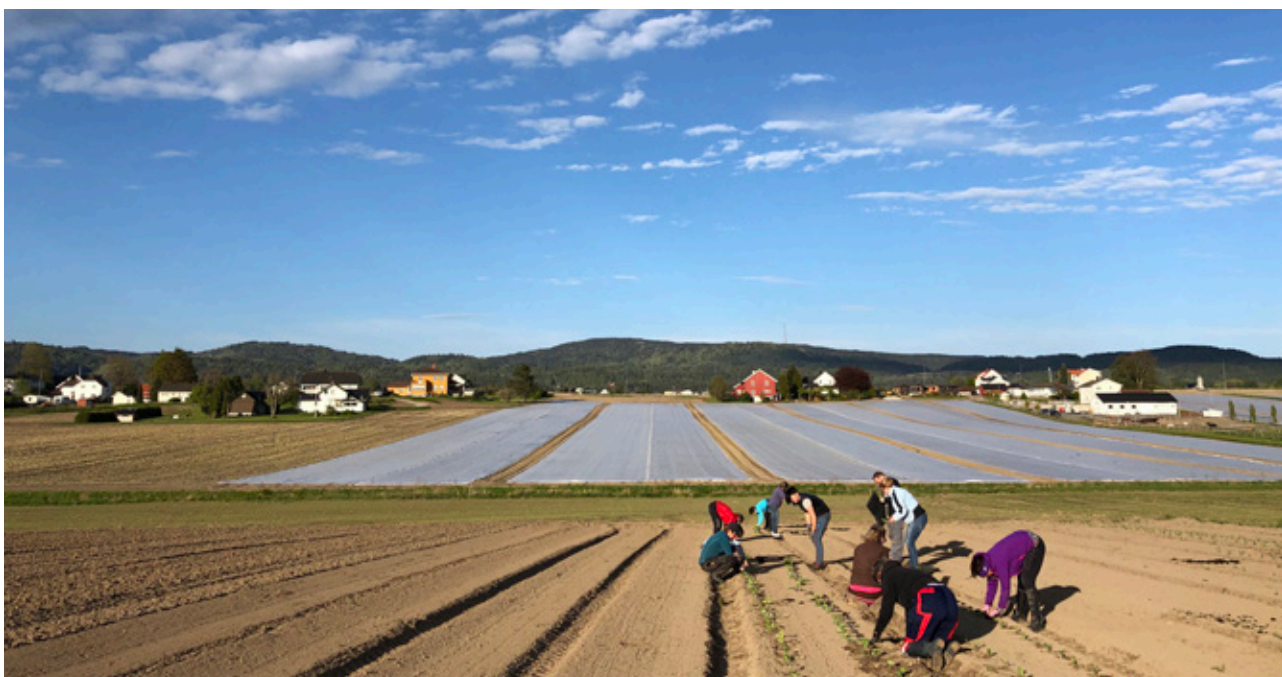
Dugnad på Århus gård, Skien.

Tiltakene som er omtalt i strategien kan gjennomføres innenfor gjeldende budsjetttrammer. Det er ikke forventet økte administrative kostnader.