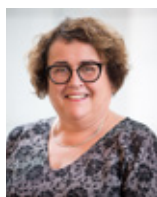
Olaug Vervik Bollestad (KrF) LANDBRUKS- OG MATMINISTER

Vi vil takke Norges forskningsråd, Innovasjon Norge, næringsliv, statsforvalterne, kommuner, forskningsmiljøer, og en rekke organisasjoner for verdifulle innspill og ser fram til videre dialog om oppfølging av strategien.