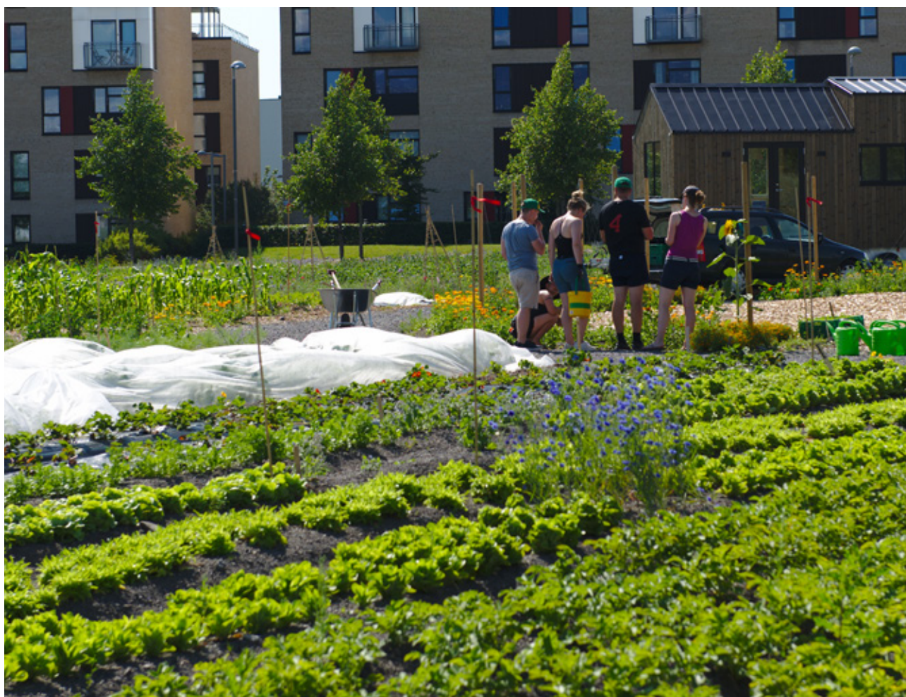
Andelshavere i Fornebu samdyrkelag lærer at ringblomst bør plukkes for at den skal sette nye blomster gjennom hele sesongen. Samdyrkelaget driftes av U.Reist på tomt som OBOS har stilt til disposisjon frem til den skal bebygges.