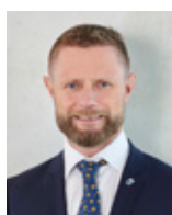
Bent Høie (H) HELSE- OG OMSORGSMINISTER