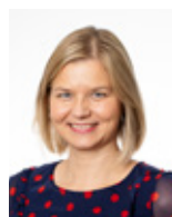
Guri Melby (V) KUNNSKAPS- OG INTEGRERINGS- MINISTER