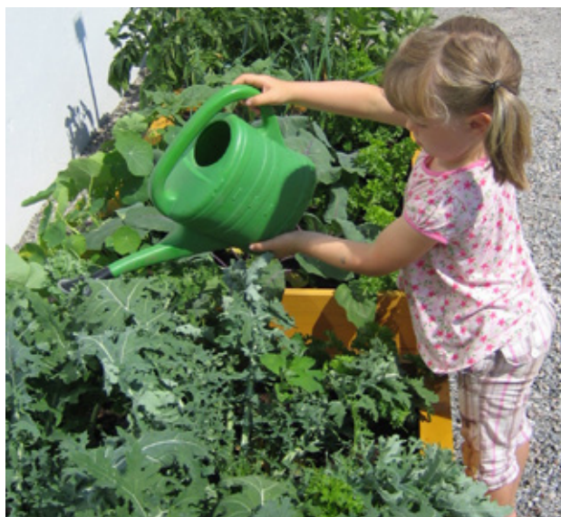
Skolehagen til NORSØK på Tingvoll Gard.