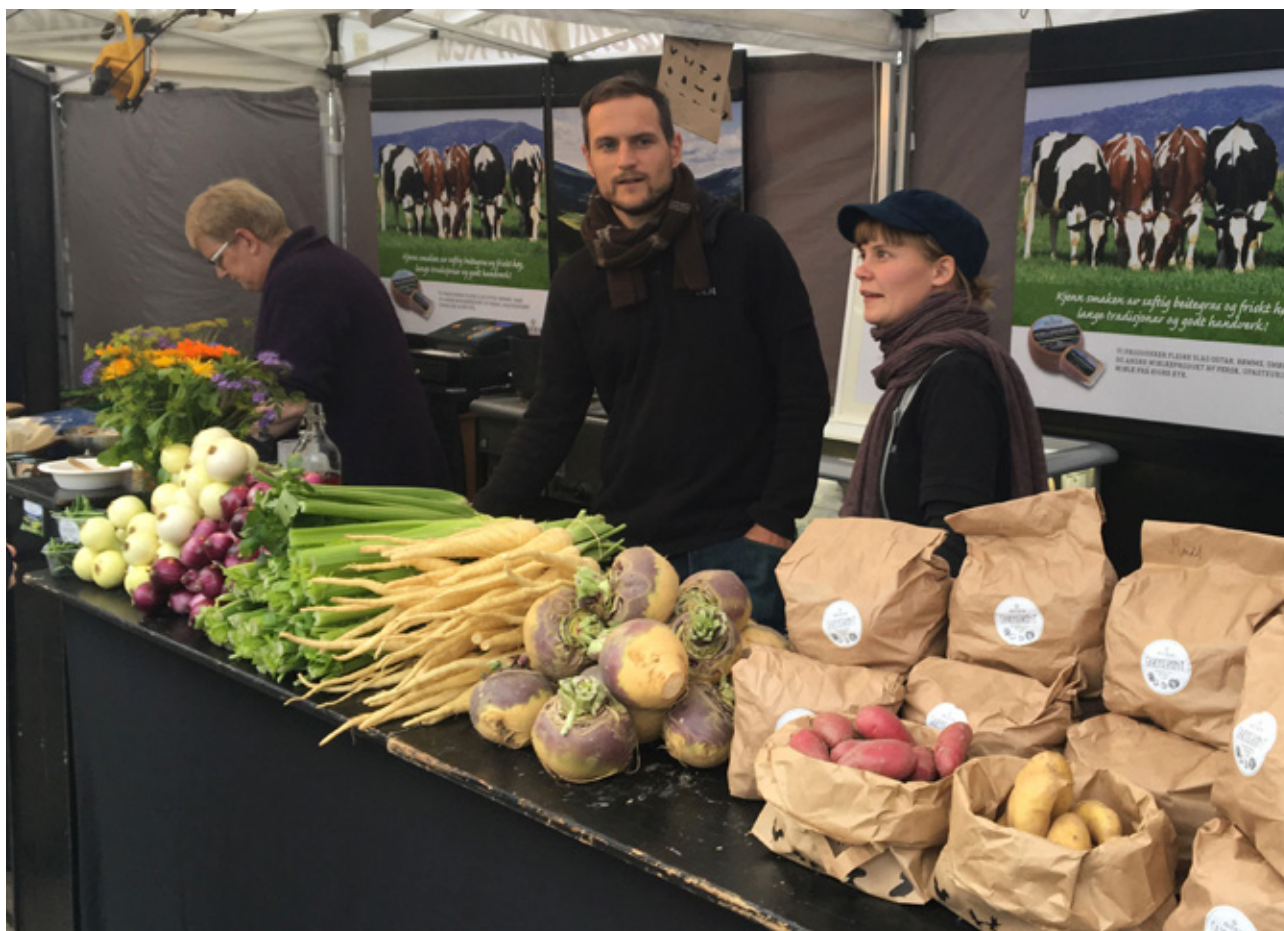
Ferske grønnsaker og lokalmat selges på Bondens Marked, matfestivaler og gårdsutsalg. Bonden formidler kunnskap og historier knyttet til produktene direkte til forbruker.