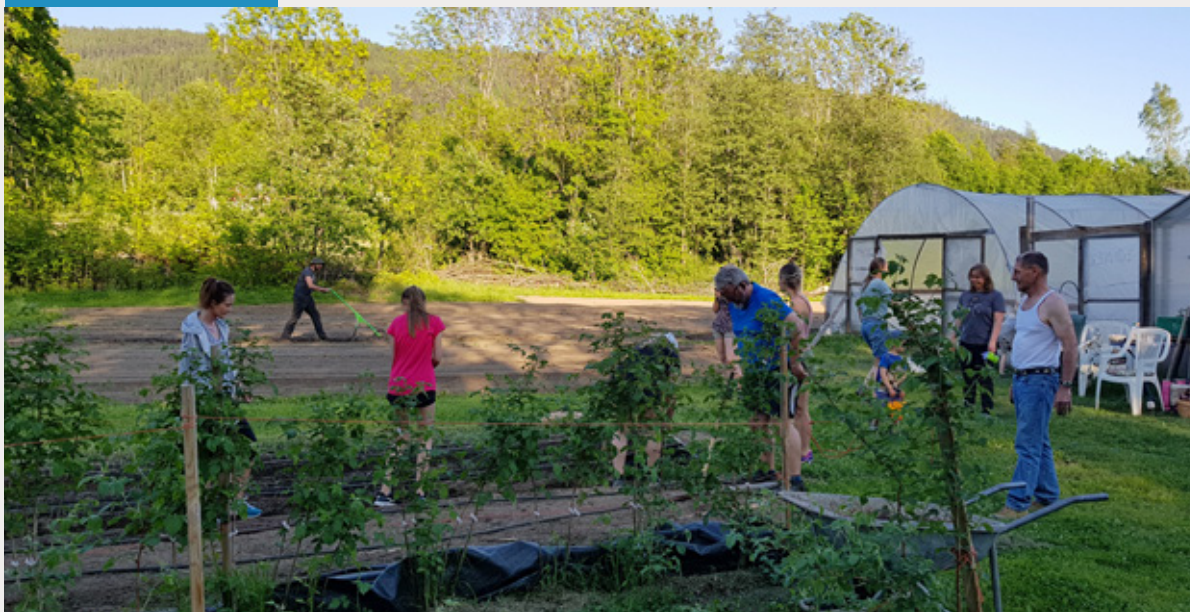
Ødeverp andelsgård, Skotselv.

Andelslandbruk er en ny spennende modell i norsk landbruk som sikrer økt produksjon av norsk mat og en direkte kontakt mellom landbruket og forbrukere. Det første andelslandbruket ble etablert i Norge i 2006, på Øverland gård i Bærum. Fra og med 2015 har antallet vokst kraftig. Per desember 2020 finnes det 91 andelslandbruk i Norge. Økologisk og sosial bærekraft er noe mange andelslandbruk behersker godt, men ofte kan det være viktig å utvikle den økonomiske bærekraften på andelsgårdene. Prosjektet «Andelslandbruk som forretningsstrategi» har utviklet planleggingsverktøyet «drive et andelslandbruk» på andelslandbruk.no .