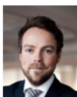
Torbjørn Røe Isaksen (H) ARBEIDS- OG SOSIALMINISTER