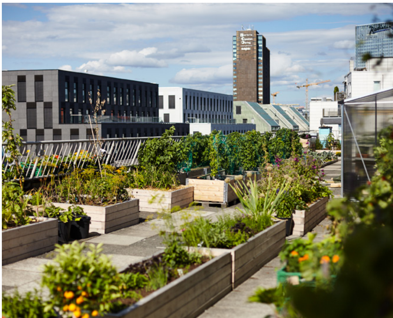
Nabolagshagers takhage «Tak for maten».

Hvordan det urbane landbruket kan bidra til bærekraftig by- og stedsutvikling er beskrevet i kapittel 3. Innsatsområdet økt kunnskap om bærekraftig matproduksjon er omtalt i kapittel 4, og omfatter både formidling av kunnskap til befolkningen, utveksling av kunnskap mellom ulike miljøer, og utvikling av ny kunnskap. Et sentralt satsingsområde i det grønne skiftet er økt verdiskaping og næringsutvikling. Potensialet som ligger i det urbane landbruket på dette området, er omtalt i kapittel 5.