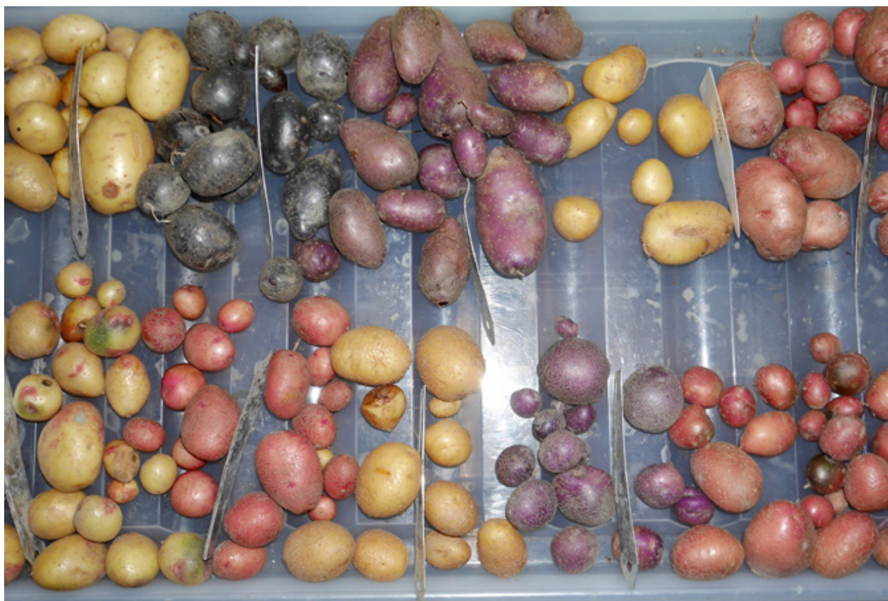
10 ulike bevaringsverdige potetsorter dyrket i KVANNs grønsaksreservat på Væres Venner Felleshage i Trondheim. Potetene på bildet øverste rad: Truls, Shetland Black, Tysk Blå, Hroars Drege, Gjernes Potet Nederste rad: Røde fra Skjåk, Beate, Ivar, Kerrs Pink Blå, Brage

Samtidig er det viktig å være oppmerksom på at avrenning av næringssalter og eventuelt jordpartikler fra urbant jordbruk kan ha negative konsekvenser for vannmiljø og økosystemtjenester som er knyttet til vannmiljø.