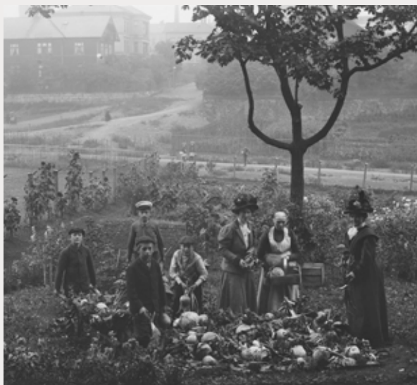
Skolehage på Bondejordet på Frogner i Kristiania i 1907 og 1909.

Den første skolehagen startet i 1906 på Bondejordet på Lille Frogner, og den kommunale driften kom i gang i 1909. Da vedtok formannskapet at en del av Geitmyra på Sagene kunne benyttes til skolehager for barn i indre by, og på det meste omfattet virksomheten opp mot 90 skoler med en deltakelse på ca. 4000 barn per år. Det var ansatt fire gartnere og en rektor i full stilling, ca. 150 lærere på deltid samt sommervikarer. Fra skolehagegartneriet på Geitmyra ble det levert planter til utplanting i hagene og på de botaniske feltene, og til innendørs plantestell i skolen.