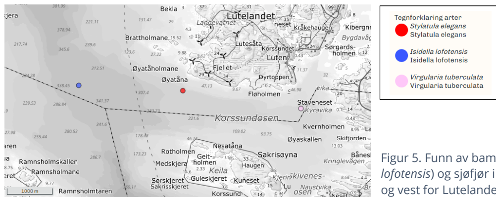
Figur 5. Funn av bambuskorall ( Isidella lofotensis ) og sjøfjør i vassførekomsten sør og vest for Lutelandet (Artsdatabanken.no).

i området (figur 4). Bambuskorallskogbunn er ei eiga vurderingseining på norsk raudliste for naturtypar, og er vurdert som sterkt trua.