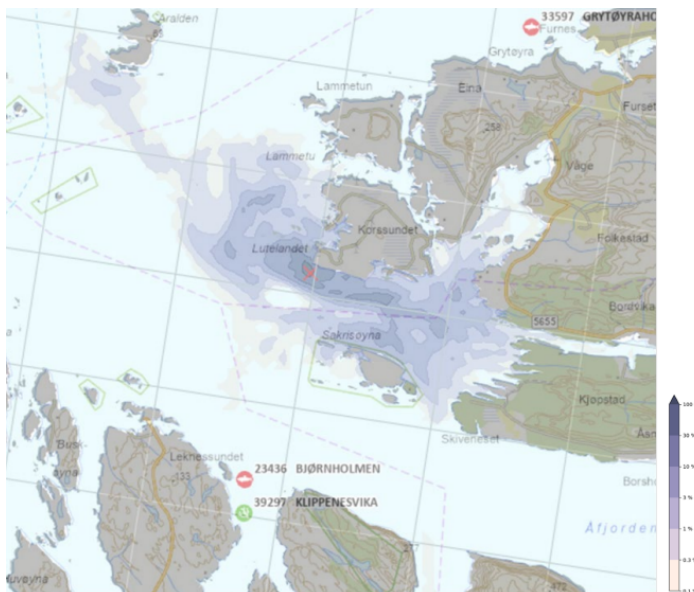
Figur 6. Høgaste oppnådde viruskonsentrasjon modellert over heile vassøyla (antatt utsleppspunkt merka med raudt kryss) og utbreieing i forhold til nærliggjande oppdrettsverksemd.

Sjølv om ein simulering av spreieing av organisk avfall føreset nokon endringar i inngangsdata er det rimeleg å anta liknande spreieing av organisk avfall og oppløyste nærings salt. Simuleringa synte spreieing frå utsleppet hovudsakeleg langs botntopografien i vest-aust retning, der partiklane heldt seg innafor djupne mellom 100 og 60 meter. I aust heldt konsentrasjonane seg høgare enn mot vest grunna sterkare straum og dermed auka utblanding i vest (figur 6). Ein kan basert på modelleringa anta noko større spreieing av organisk utslepp mot aust enn mot vest. Modelleringa synte lite spreieing av partiklar opp til overflata, og indikerer såleis låg risiko for spreieing av nærings salt til den eufotiske sona.