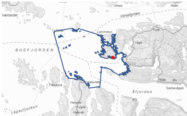
Figur 3. Vassførekomsten Vilnesfjorden-ytre, med Lutelandet markert med rød sirkel.

Lokaliteten Lutelandet har vassførekomsten Vilnesfjorden-ytre (Vann-Nett-ID 0280030302-C 2 , Figur 3) som resipient. Vassførekomsten er karakterisert som open eksponert kyst som samla sett er vurdert til å ha god både kjemisk og økologisk tilstand. Den økologiske tilstanden er basert på data om mellom anna botnfauna, oksygentilhøve og metalla kopar og sink, og kunnskapsgrunnlaget er vurdert som middels. «God økologisk tilstand» reflekterer her miljøtilhøve tett opp til naturtilstanden.