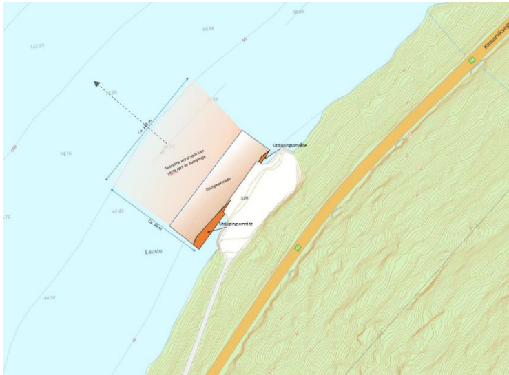
Figur 1 Oransje polygon markerer omtrentleg kvar det skal sprengjast («Utdjupingsområde»). Dumpeområde er angjeve nærast utdjupingsområdet, og teoretisk areal som kan verta rørt av dumpinga er også illustrert.

Eksisterende kai er omfatta av reguleringsplan Kyrkjeneset tømmerkai 1 .