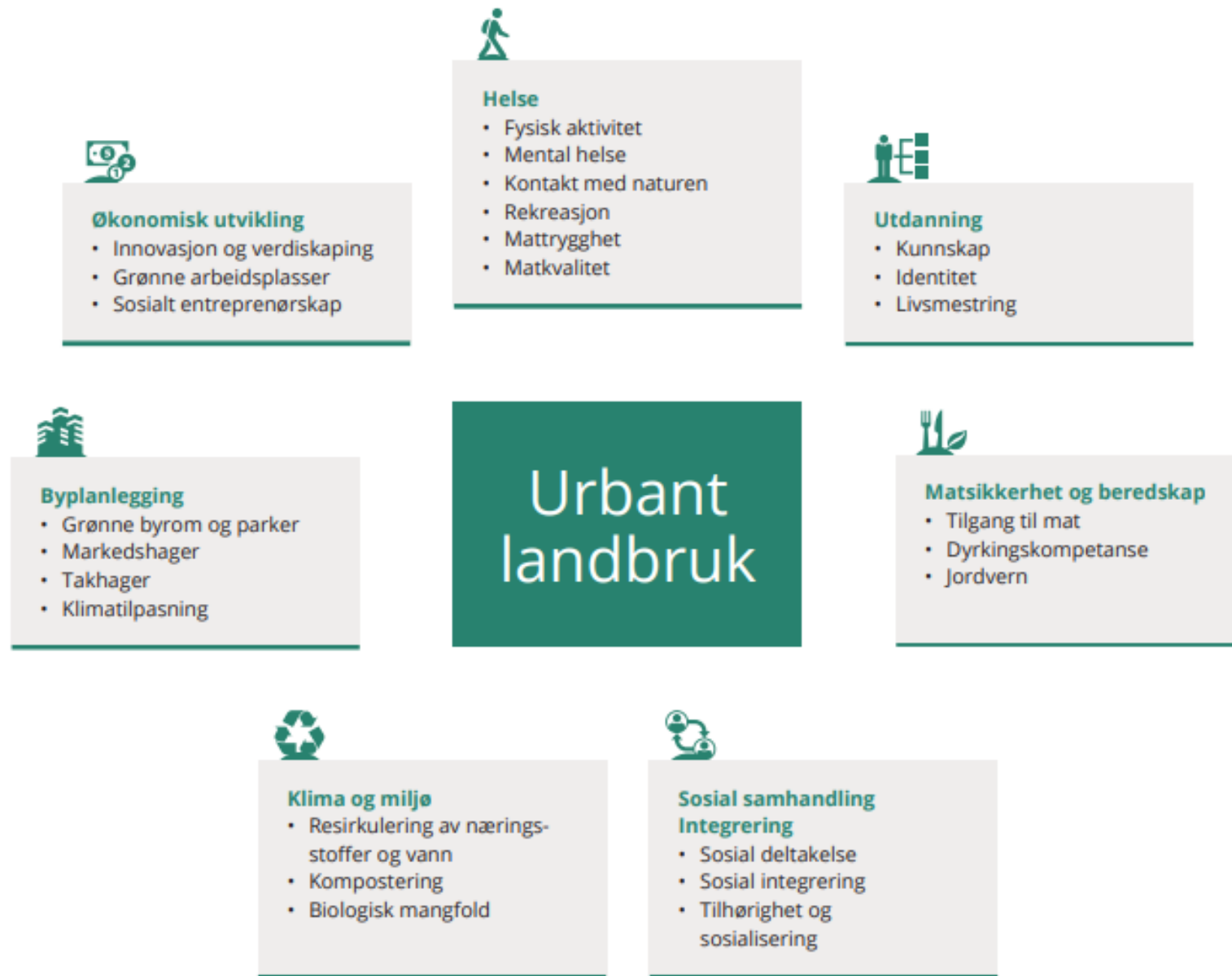
Figur 1 illustrerer hvordan urbant landbruk kan gi måloppnåelse på en rekke samfunnsområder. 6