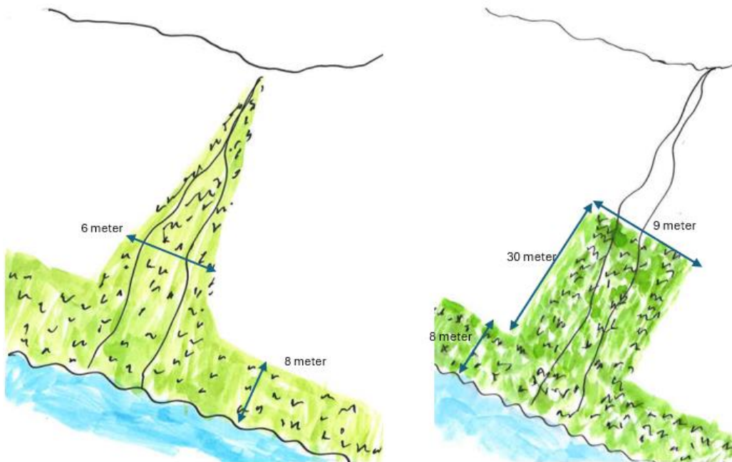
Illustrasjon: Gras i dråg med 6 m bredde ned til buffersone langs vassdrag t.v. Bremskloss på 30 m langs dråget og 9 m bredde th. Statsforvalteren i Vestfold og Telemark