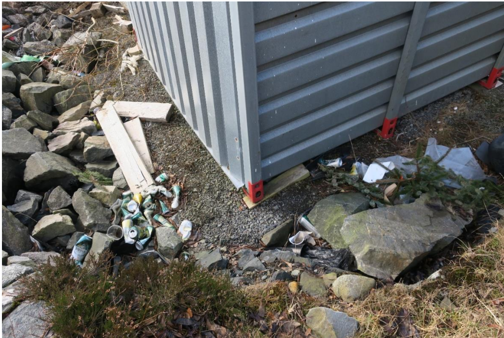
Eksempler på forsøpling utenfor anlegget: