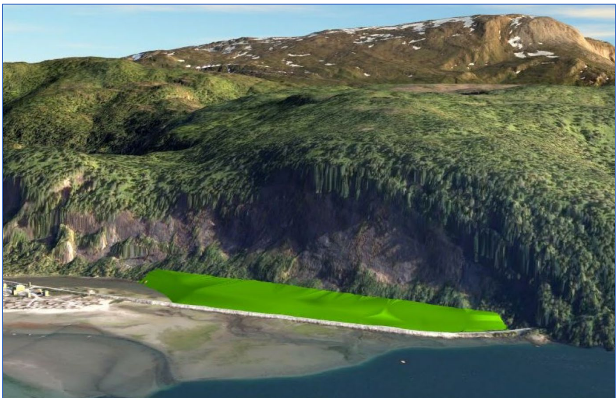
Modell slik masselager vil se ut ved 100% oppfylling