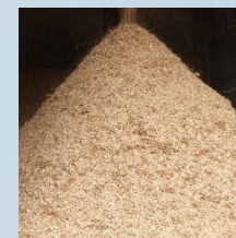
Flis fra sagbruka som ressurs