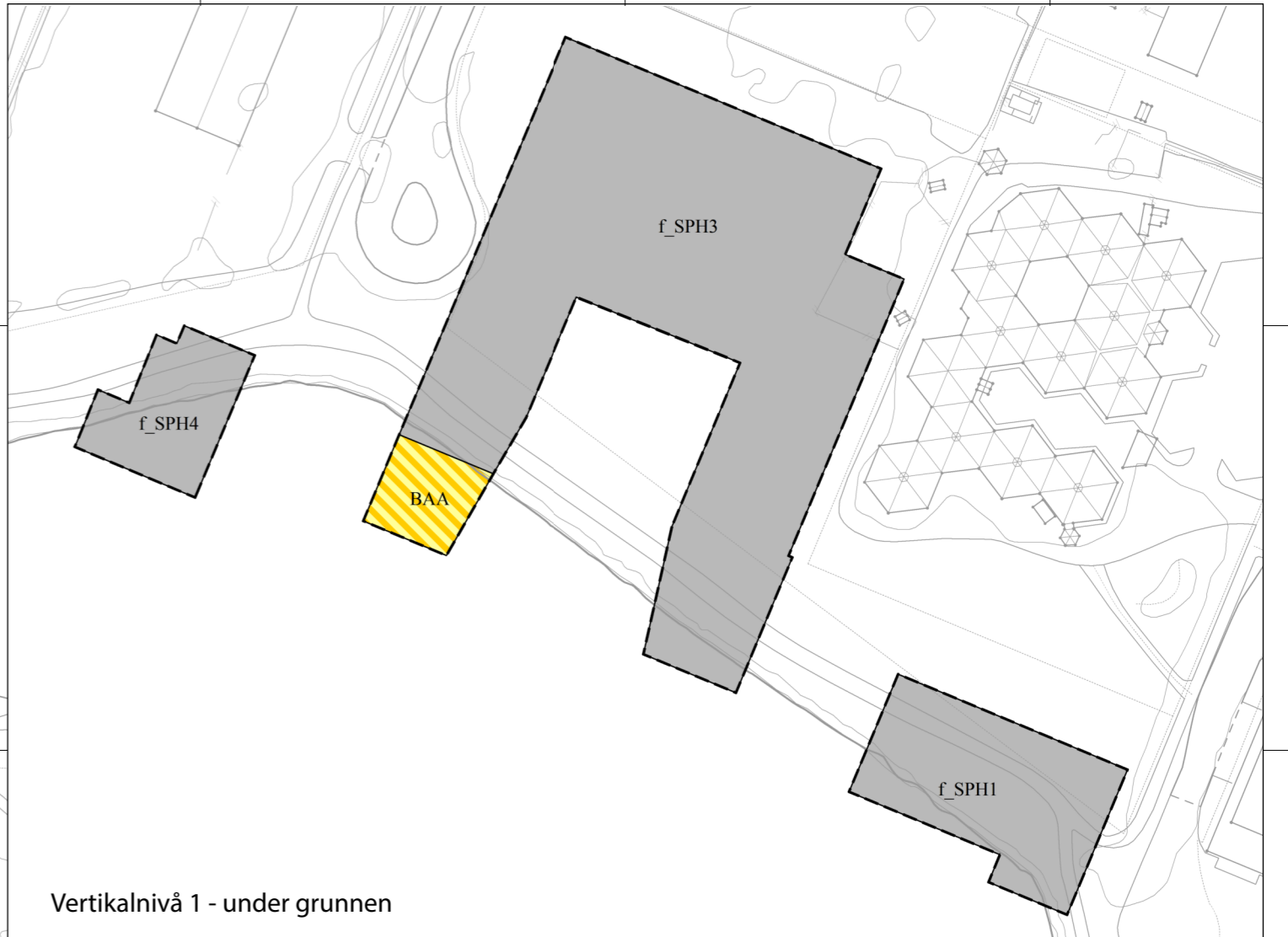
Vertikalnivå 1 - undergrunnen