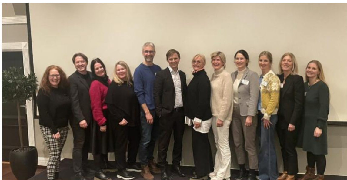
På bilete: Styringsgruppe for nettverket, bestående av kompetansemiljø, statsforvaltar samt kommunalsjefer og kommunerepresentantar.

Styringsgruppa vart etablert på første samling i desember 2023, med fem hovudrepresentantar og fem vara frå kommunane. Både kommunalsjefnivået og kommunane sine representantar i nettverket er i styringsgruppa, i tillegg til dei som representerer dei ulike kompetansemiljøa og Statsforvaltaren i nettverket (sjå punkt over).