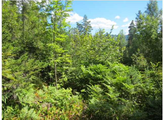
Ungt kratt på kalkrik mark på hylle mellom KO1 og KO2.