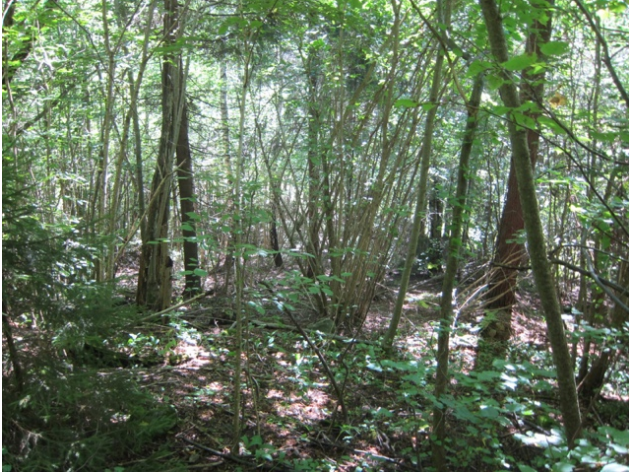
Kalkhasselskog med gran.