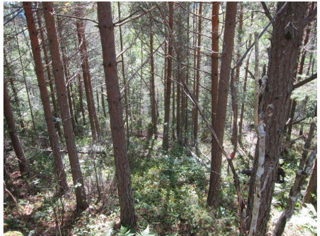
Ung ensaldret furuskog i lia mellom KO1 og KO2