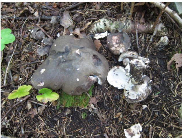
Grangråkjuke (NT)