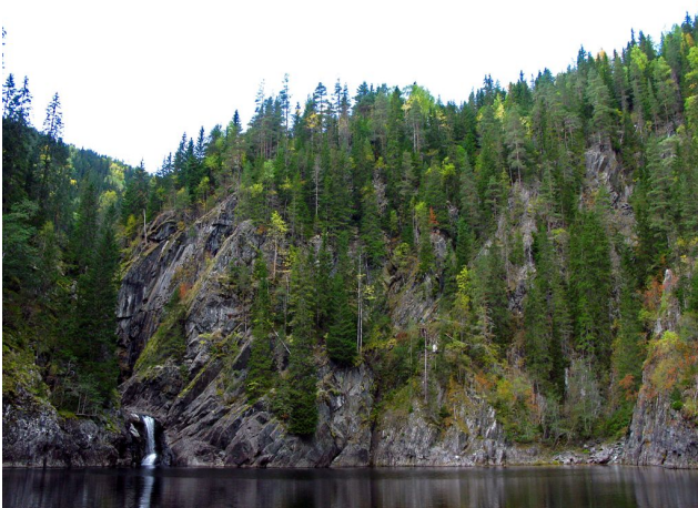
Naturen er dramatisk i elvejuvet, her fra Landhølen i kjerne 4, hvor det før reguleringen var en stor foss.