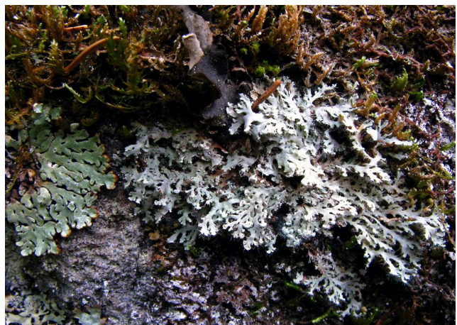
Lavfloraen på bergvegger er svært rik, og elfenbenslav ( Heterodermia speciosa ) (høyre) og hodeskoddelav ( Menegazzia terebrata ) opptrer begge rikelig.