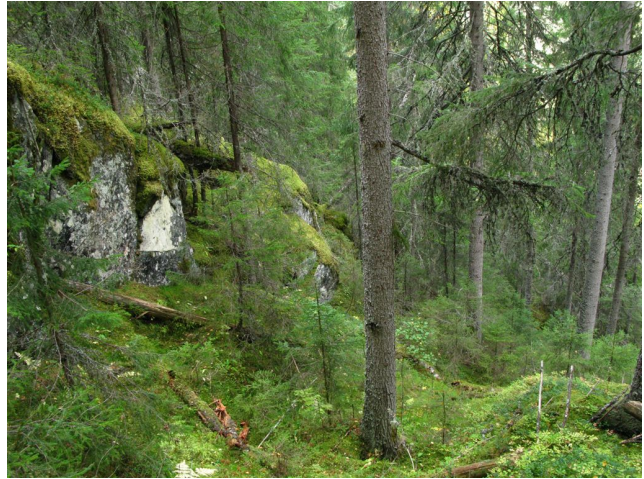
I dalsidene er det mye gammel, fuktig aldersfasegranskog (kjerne 4, litt ovenfor Landhølen).