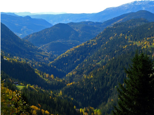
Øygardsjuvet er ei stor og mektig elvekløft, den største i Buskerud, her sett sørover fra Bjølldokka øverst i dalen.